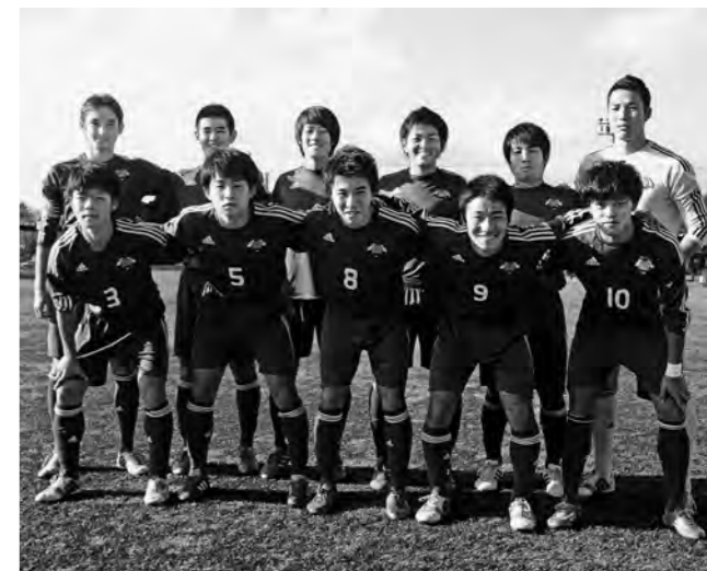
↑プレミアリーグを戦い抜いたJFAアカデミーイレブン