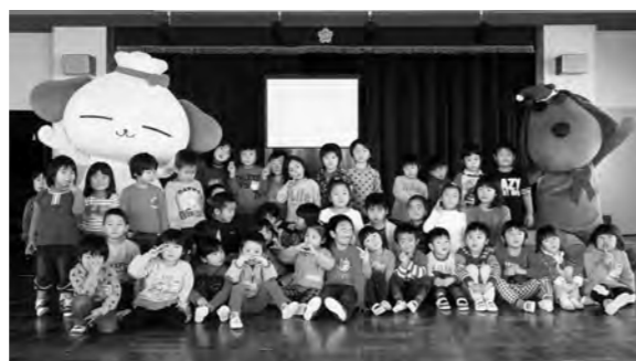
←ラフくん・ふくたんを撮影する園児

平成26年12月9日（火）、フジテレビが展開している「ずっと応援プロジェクト」の一環として、フジテレビのアナウンサーやキャラクターが広野幼稚園に来園しました。キャラクターに触れたり、一緒に歌ったり踊ったりして楽しく過ごしました。