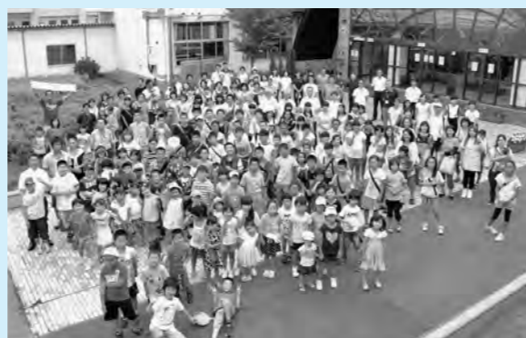
↑広野町再会交流事業「集まれ!!ひろのっこ」の様子

町では、原子力災害により避難先市町村の認可保育所および認定子ども園内保育所に入所している児童の保護者に対し、申請に基づき保育料の2分の1の助成を行っています。 助成期間は、平成26年4月分から平成27年3月分までです。 詳細については、お問い合わせください。