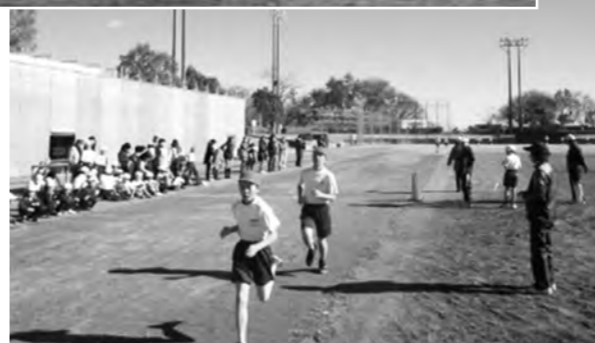
↑校内持久走大会の様子

平成26年12月初旬の、広野小の様子です。朝晩の気温はぐっと下がり、もうすっかり冬の風景です。そんな中でもいいお天気の日には子どもたちは休み時間に元気いっぱい外で遊んでいます。まだ半袖、半ズボンで過ごしている児童もいます。また、広野町総合グラウンドで校内持久走大会を行いました。400mトラックを使って、1・2年生は2周（800m）、3・4年生は2周半（1,000m）、5・6年生は3周（1,200m）走りました。寒さに負けず、がんばれひろのっこ。