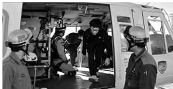
←防災ヘリコプターを見学する生徒

平成26年11月19日（水）、防災ヘリコプター訓練を見学しました。ヘリコプターの内部だけでなく、離陸や着陸訓練を見せてもらいました。ヘリコプターの離陸の時には、歓声があがりました。生徒たちは、普段あまり見ることのない消防署員の命がけの仕事を見ることができ、大変感動しました。