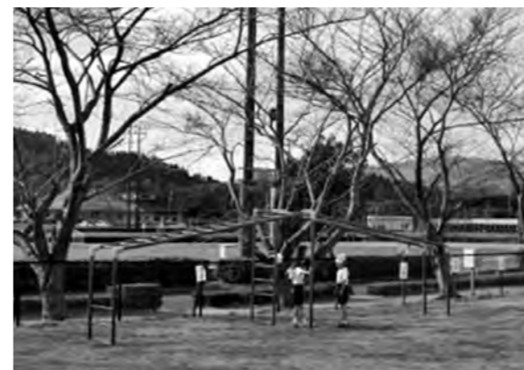
←半袖・半ズボンで外遊びする児童