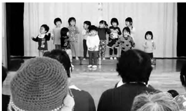
←お楽しみ会の様子

平成26年12月3日（水）に、広野町老人クラブの皆さんとの交流会「お楽しみ会」をしました。お遊戯や歌・ダンスなどを披露し合い、楽しく過ごしました。写真は、「ドレミの歌」を一緒に歌っているところです。