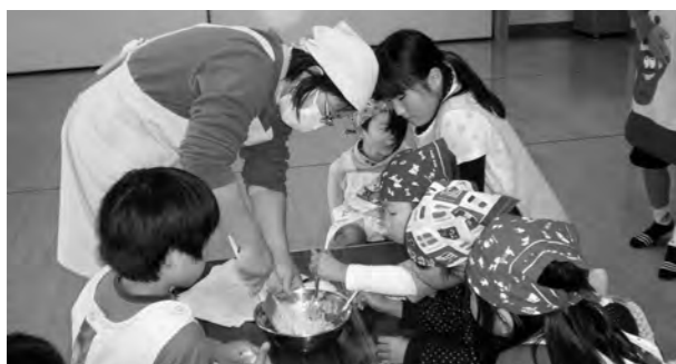
←蒸しパン作りをする児童

平成26年11月19日（水）にコーンやサツマイモの入った蒸しパンを作りました。おやつに食べたら、おいしくてみんなの心がほんわかあつたかくなり大喜びでした。広野町食生活改善推進協議会の皆さんに手伝ってもらいながら、なつかしいお菓子が出来上がりました。