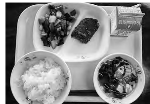
←まごわやさしい給食