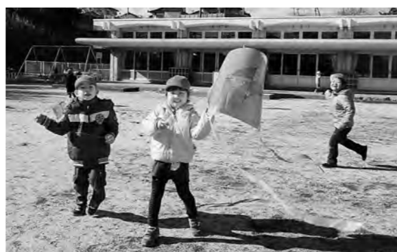
←凧揚げを楽しむ園児たち

1月8日(木)、3学期が始まり、子どもたちは久しぶりに友達に会えてうれしそうです。さっそくみんなで園庭に出て、凧揚げをしました。凧には、自分たちで好きな絵を描きました。