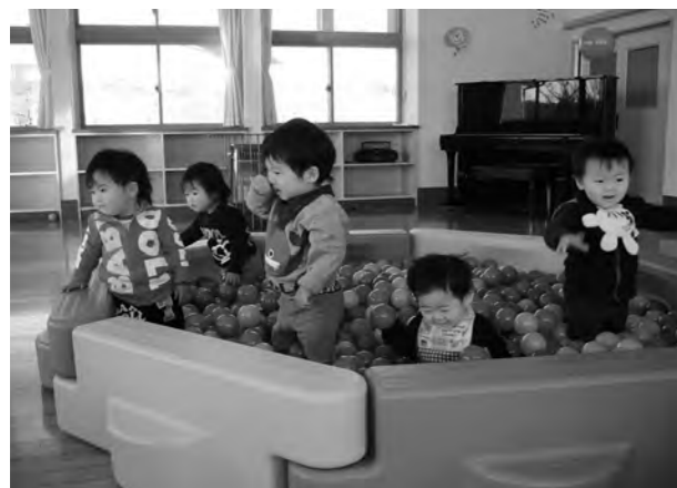
←ボールプールで遊ぶ子どもたち

遊戯室の遊具で楽しく遊んでいる0歳児さくら組の子どもたちです。子どもたちは、友達と一緒にボールプールへ入るのがお気に入りです。