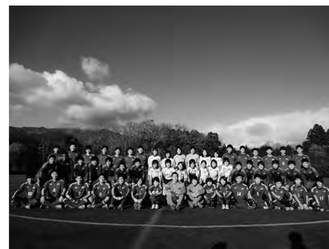
↑JFAアカデミー福島新チームのメンバー