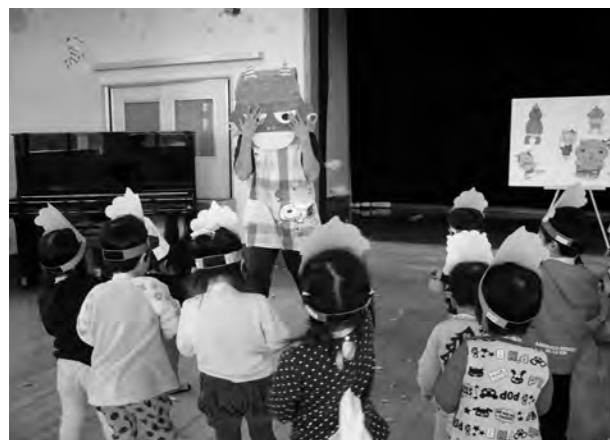
←豆まき会をする子どもたち

2月3日(火)、保育所で豆まき会をしました。節分のお話を聞いたあと、みんなで「おにはーそと！ふくはーうち！」と元気いっぱい豆をまきました。