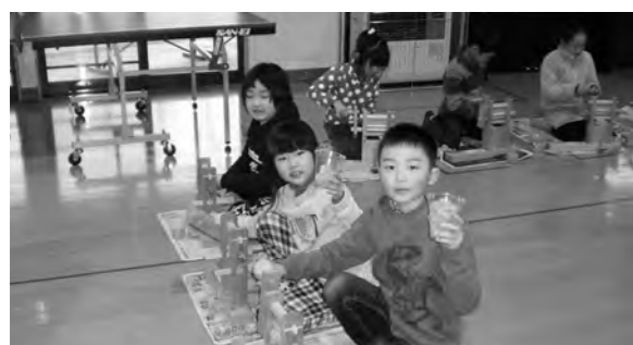
←綿繰りと糸紡ぎを体験した子どもたち

1月21日(水)に綿繰り機を使って種取りをしました。種が出てくるまで熱心にチャレンジし、とても楽しかったようです。そして、ガラ紡ぎ機を使って綿から糸を紡ぐことができると「すごい！」と目を丸くしていました。