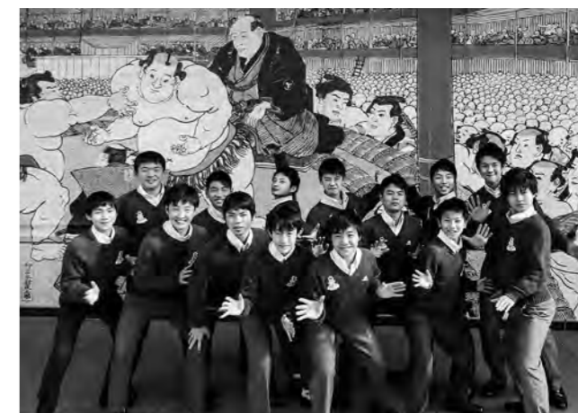
↑JFAアカデミー福島7期生のメンバー