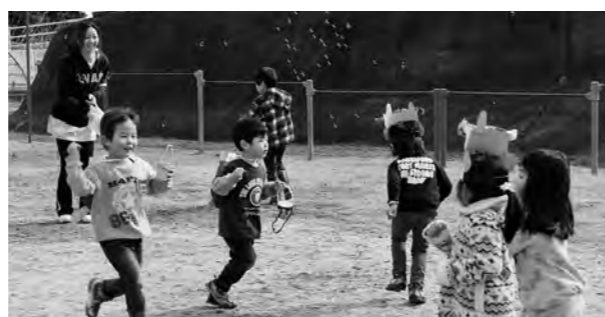
←豆まきを楽しむ園児たち

2月3日(火)の節分に、広野幼稚園の園児が豆まきをしました。豆をまく役と鬼役に分かれて交代で行い、鬼役のときは自分で作った鬼のお面をかぶりしました。最後に先生から年の数だけピーナッツをもらい、みんなで食べました。