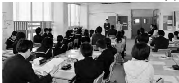
←長野県弁護士会による法教育授業の様子

1月23日(金)、広野中学校1年生と広野小学校6年生が合同で長野県弁護士会による法教育授業を受けました。テーマは司法制度についてで、弁護士会の弁護士が模擬裁判で刑事被告人、検察官、裁判官、弁護人、証人(被害者)を演じる中、生徒と児童は裁判員になって、裁判員裁判のことを学びました。子どもたちには少し難しい内容ですが、各テーブルに着いた弁護士から補足説明を受け、法律に関する興味をそそられたようです。