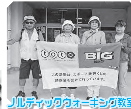
Jルディックウォーキング教室