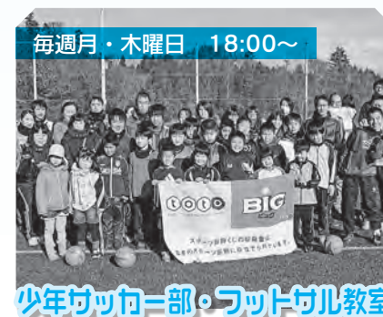
少年サッカー部・フットサル教室