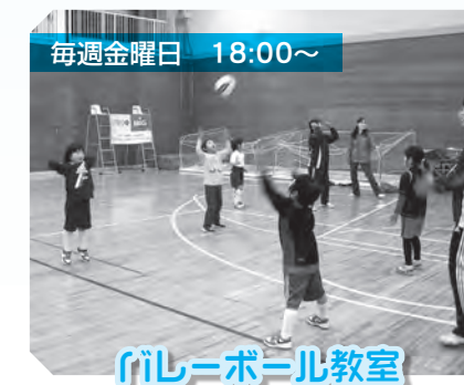
バレーボール教室