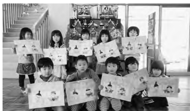
← 折り紙で作ったひな人形

3月3日（火）、折り紙を折っておひなさまを作りました。個性なおひなさまが勢ぞろい。本物のおひなさまも、子どもたちをやさしく見守っています。