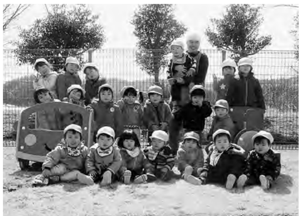
← 保育所の子どもたち

庭で一緒にたくさん遊んだあと、ひまわり組さんとさくら組さん。みんなで一緒にハイポーズ！保育所のかわいい子どもたちです。