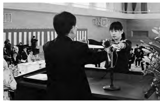
↑ 本来の広野中体育館で卒業証書を受け取る卒業生