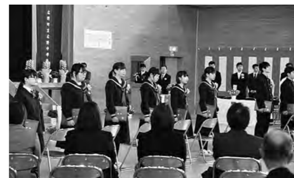
↑ 保護者や恩師に見守られて巣立つ卒業生

3月13日（金）、広野中学校の卒業証書授与式が本来の広野中学校体育館で行われ、生徒17人が卒業しました。広野中学校の学校施設は、今月8日（水）に開校式を迎えるふたば未来学園高校が仮校舎として使用するため、広野中学校の生徒は、平成26年度の第2学期から広野小学校の校舎で学習しています。この日卒業した生徒の1人が、平成26年6月に実施した国際シンポジウムで「思い出の校舎で卒業式を迎えたい」と発言し、実現したものです。