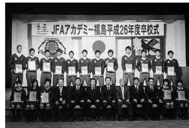
↑ 卒校式に臨んだJFAアカデミー福島4期生一同