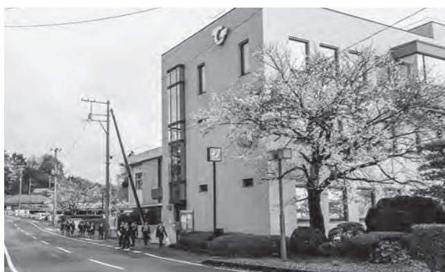
↑高校生の通学風景