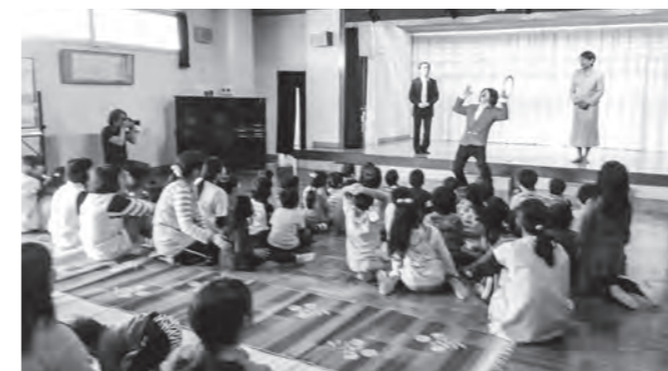
←園児と交流するコント集団

5月7日(木)、コント集団「ザ・ニューズペーパー」が広野幼稚園を訪れ、政治家に変装してジャグリングを披露するなど、園児と交流しました。会場には、アメリカの子どもたちからの絵手紙が展示されました。また、園児からアメリカの子どもたちへ贈るお礼の絵手紙を、ザ・ニューズペーパーに託しました。