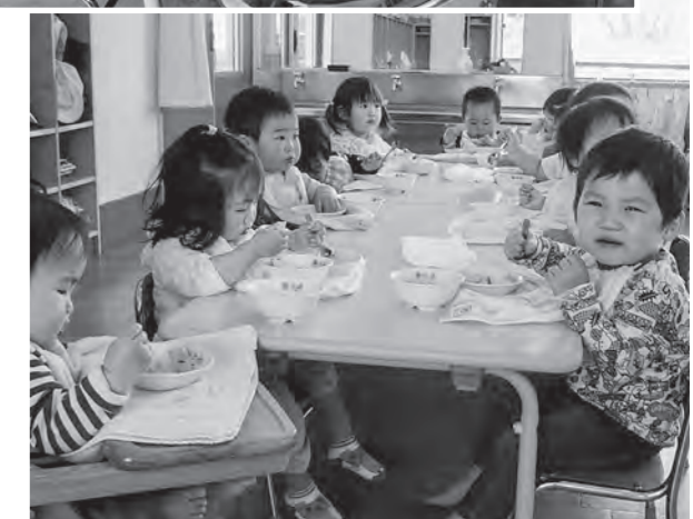
↑給食を食べる1歳児

1歳児・ひまわりぐみの給食風景です。毎日、おいしい給食をみんなで一緒に食べています。