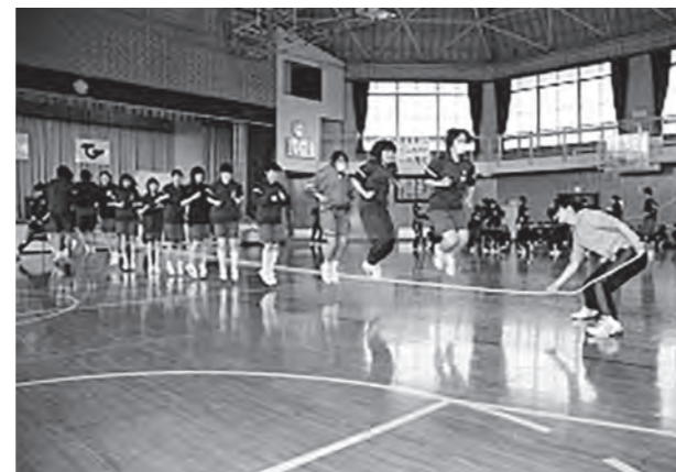
←スプリング・レクリエーションの様子

4月16日(木)、全校生徒によるスプリング・レクリエーションを行いました。広野中バスケット、二人三脚、ブレインポーカー、長縄跳びの4つの種目に心を一つにして臨んだ生徒たちは、友人の声援を受けながら、精一杯のフェアプレーを心がけました。クラスのために頑張ろうとするその姿勢は、見守る先生にもひしひしと伝わり、レクリエーション後には、お互いの健闘を称え合う姿が見られました。生徒の素晴らしい一面が垣間見られた行事でした。