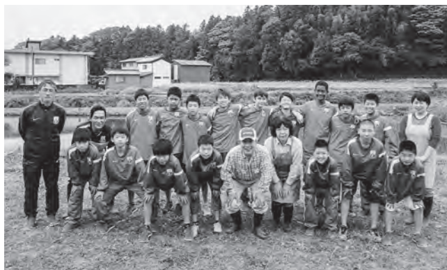
↑田植えをしたJFAアカデミー福島10期生