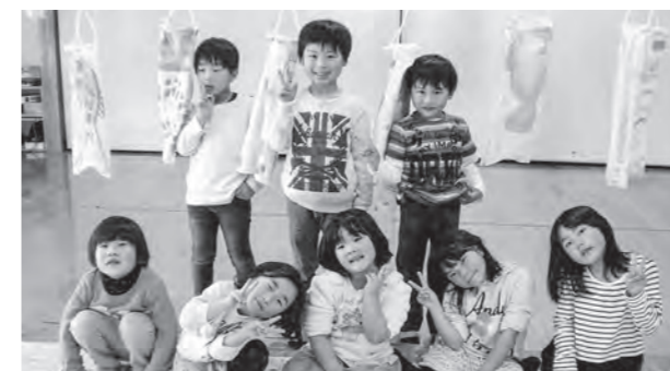
←元気がいっぱい1年生8人

児童館では、現在56人の児童が毎日元気に遊んでいます。中でも1年生8人は、ちょっぴりのドキドキとワクワクの4月を過ごし、鯉のぼりのように元気いっぱいです。あしたもきっと来なくなる、児童館をめざしてVサイン!