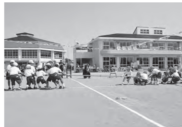
←震災後初めて校庭で開催された運動会

5月17日(日)、五月晴れのなか、広野小学校校庭で運動会を開催しました。一昨年度と昨年度の運動会は広野町多目的広場で行いましたので、校庭で開催したのは、東日本大震災後初めてのことで。競技は昼食をはさんで午後まで行い、紅組が優勝しました。