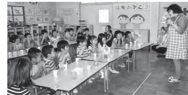
← 歯磨き指導の様子

6月12日（金）に歯科衛生士さんの指導を受け、歯磨きの仕方や歯の大切さを教えてもらいました。なんでも食べる、よくかんで食べる、食べたらず歯磨きをすることを約束しました。