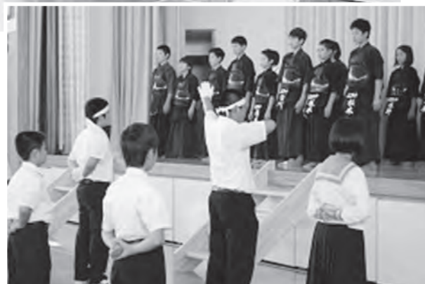
↑ 中体連地区予選壮行会の様子

6月4日（木）、福島県中学校体育大会相双地区予選大会壮行会が行われました。当初、壇上の剣道部、バドミントン部の選手たちは緊張した面持ちでしたが、決意表明では大会への意気込みを堂々と発表し、広野中学校の生徒として最後まであきらめずに競技することを心に刻んだようです。応援団の力強い声援を受け、全校生が心を一つにした壮行会でした。