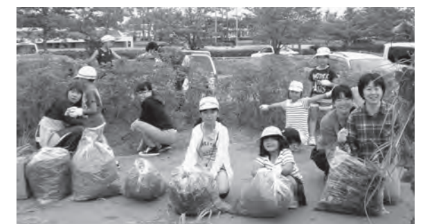
← 草取りの奉仕活動をする子どもたち

6月5日（金）、奉仕作業を行い、子どもたちは保護者の力を借りて、元気いっぱい児童館の草取りをしました。保護者の皆さんのご協力に感謝します。