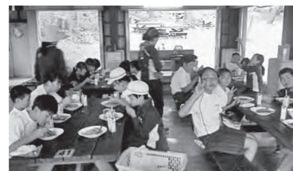
← 自分たちで作ったカレーライスをはおはる5年生

6月2日（火）から4日（木）までの3日間、5年生26人が磐梯青少年交流の家で宿泊活動を行いました。2日目には野外炊飯でカレーライスを作りましたが、火おこしから野菜を切って炒めて煮込むのも自分たちで行い、おいしさも格別だったようです。