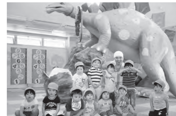
← 恐竜の前でポーズをとる2歳児

5月29日（金）に、いわき市海竜の里センターで園外保育を行い、元気いっぱい遊んできました。写真は、2歳児・たんぼぼ組の子どもたちです。