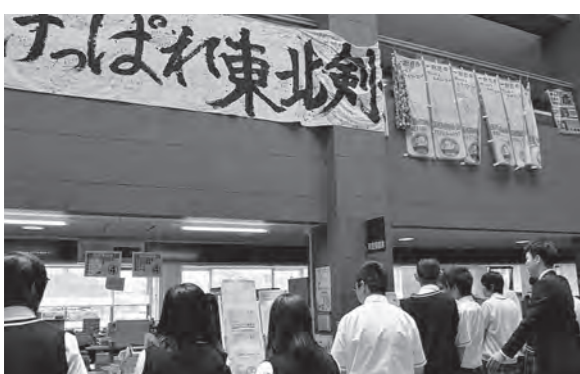
← 役場内を見学するふたば未来学園校生