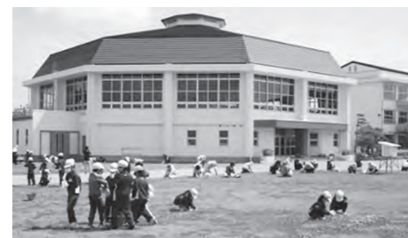
← クリーン作戦で校庭の除草作業をする児童

6月8日（月）、第1回のクリーン作戦を実施し、広野町社会福祉協議会の協力を得て、校庭の除草作業などを行いました。みんなで力を合わせてかなりの草を取り、校庭がとてもきれいになりました。