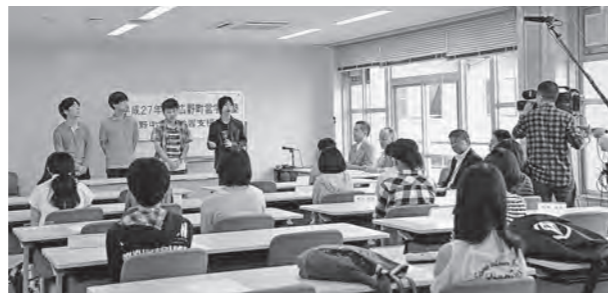
← 町営学習塾開校式の様子

6月27日(土)、広野町中央体育館2階ミーティングルームで、平成27年度中学生学習支援事業・広野町営学習塾の開校式を行いました。この事業は、首都圏の大学生が週末や夏休みを利用して広野中学校の生徒に勉強を教えるもので、今年度はこの塾を卒業したふたば未来学園高校の生徒も参加しています。学習塾は、28日(日)も実施しました。