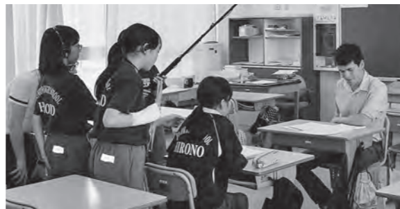
← インタビューを体験する子どもたち

7月14日(火)、広野中学校で映画製作を通して古里の良さや伝統、文化を再発見する授業「いいな広野ふるさと再発見」を開始しました。東日本大震災後に双葉郡8町村で行っている「ふるさと創造学」の一環です。生徒たちはビデオカメラなどの使い方を本職の映画監督から学び、先生や友達のインタビューに挑戦しました。