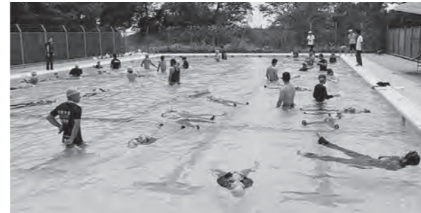
← 着衣泳講習の様子

7月15日(水)、夏休みを前に全学年が参加して着衣泳講習を行いました。講師は水難学会指導員の資格を持つ現役の消防士です。万が一溺れそうになっても、慌てないで大きく息を吸い込んで仰向けになり、ペットボトルなど浮いているものをつかんで浮いて待つこと、もし水の事故を見つけたら、通報して励まし、二次被害防止のためにも絶対に助けにいかないことを学びました。