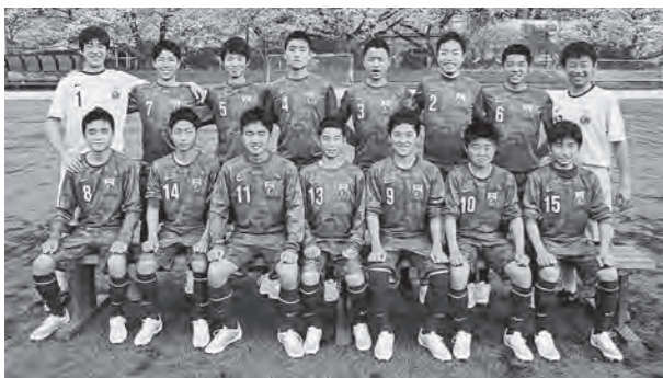
← 全国大会に出場する8期生