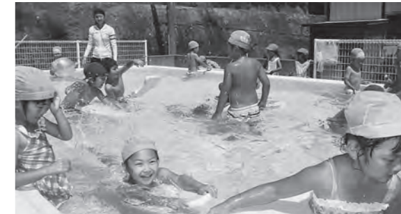
← プール遊びで楽しむ子どもたち

お天気の良い日はプール遊びを楽しんでいます。晴れていると「きょうは、プールに入れるね!」と朝から楽しみにしている子どもたち。プールの中でも元気いっぱいです。