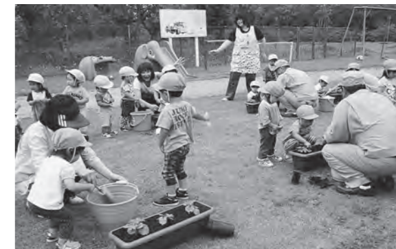
← 緑のカーテンづくりをする子どもたち

6月19日(金)、環境学習教室で子どもたちがアサガオやゴーヤの苗をプランターに植え、水やりをしました。これから苗がどんどん伸びて、涼しげな緑のカーテンになるのを楽しみにしています。