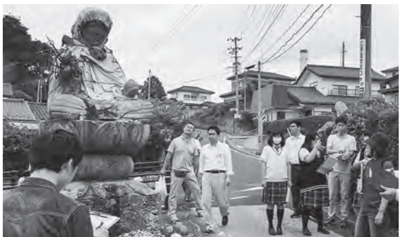
← まちあるきワークショップの様子