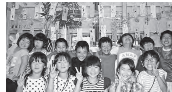
← 七夕の飾りつけをした子どもたち

7月7日(火)、七夕の飾りつけをしました。アイスのふたにお星さまやおり姫、ひこ星がキラリ!短冊にも夢がいっぱい!元気な笑顔とみんなの願い事、天まで届きますように。