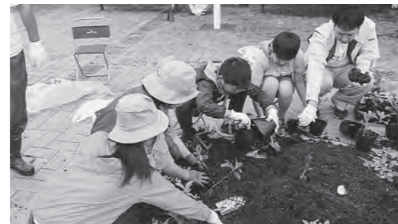
← 防災緑地の苗を株分けする緑の少年団

7月4日(土)、広野小学校6年生児童で構成する緑の少年団が、二ツ沼総合公園で行われたどんぐりプロジェクトの株分け作業に参加しました。苗は、町内で拾い集めたどんぐりから育てたクヌギやコナラで、来年3月に防災緑地に植樹する予定です。