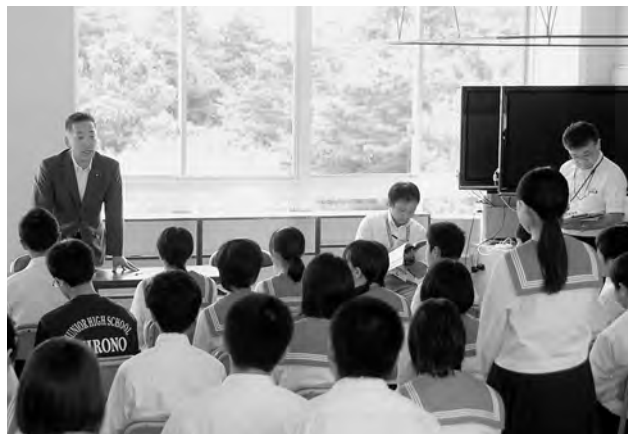
↑ 広野中学生と町長との懇談会の様子