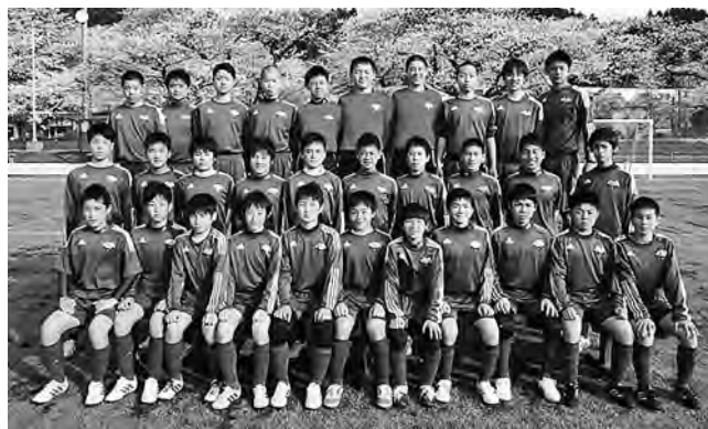
↑全国大会に出場したJFAアカデミー福島U-15チーム