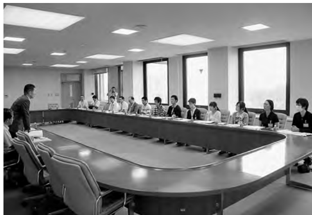
広野町の復興状況を聞く医学部学生ら ↑