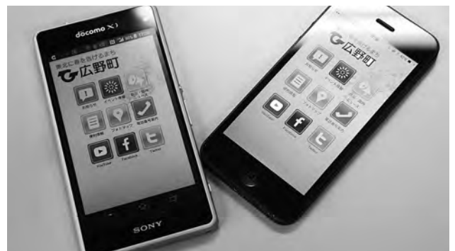
↑ 公式アプリの初期画面

メニューは、①お知らせ、②イベント、③防災臨時ニュース、④便利情報、⑤フォトマップ、⑥電話番号案内、⑦公式Youtube（動画）チャンネルページ、⑧公式Facebookページ、⑨公式Twitterページです。