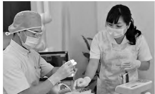
再開した歯科診療所

7月15日から19日までの5日間、総合検診を行い約700人の方が受診されました。また、10月5日、日曜日に検診日を設け、未受診である方に対して受診を呼びかけてまいります。