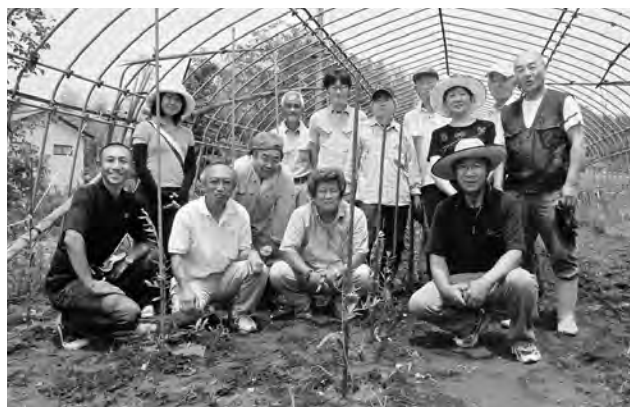
↑ひろのオリーブ村会員とさいたま桜高等学園の代表者ら

6月21日（土）、ひろのオリーブ村にさいたま桜高等学園の園生が育てたオリーブの苗木50本が寄贈され、同村会員と同学園の代表者たちが、広野町大字上浅見川字大谷内の畑にそれらの苗を植えました。