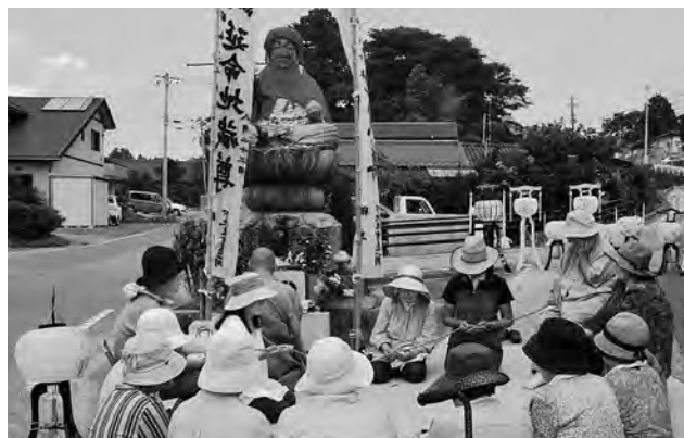
↑下北迫地蔵講の様子