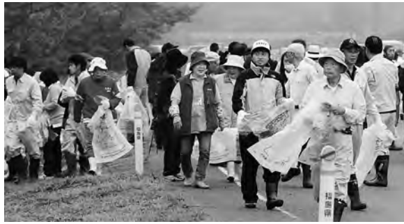
クリーンアップ作戦

たことに對し、衷心より御礼を申し上げます。今後もふるさとの復興再生と河川環境の保全、きれいな町づくりに努めてまいります。