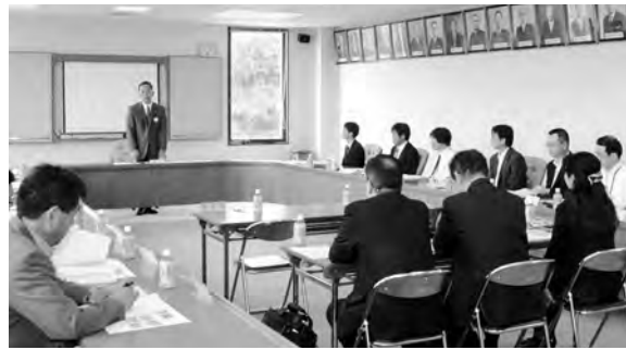
広野町除染等に関する検証委員会

広野町除染等に関する検証委員会は、今日まで3回の会議を行い町などが実施してきた各種調査データの検討を行っており、今後は委員会としての検証報告の取りまとめを行ってまいります。