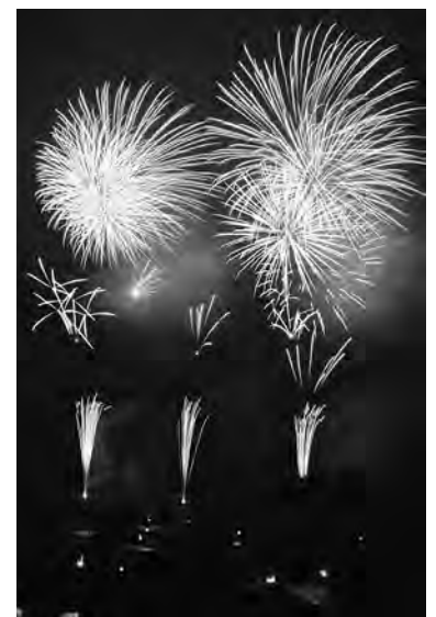
広野町サマーフェスティバル2014

8月9日に広野町サマーフェスティバル2014を広野駅南駐車場を会場に開催し、森内閣府特命担当大臣、清水いわき市長および