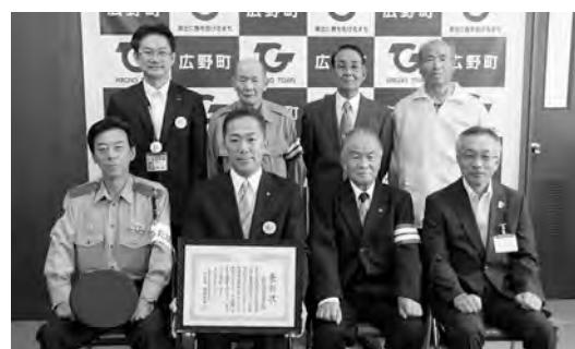
交通死亡事故ゼロ3000日を達成

7月17日24時をもって、町内における交通死亡事故ゼロ3000日を達成いたしました。翌18日には町役場で知事表彰の伝達式が執り行われ、富岡地区交通安全協会広野分会のみなさま、ならびに双葉警察署長の立ち会いのもと表彰を受けました。