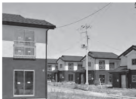
災害公営住宅「広野原団地」

7月22日に開催された災害公営住宅名称選考委員会において、当町に建設している災害公営住宅の名称が、「 ひろのぼらだんち 広野原団地」に決定いたしました。災害公営住宅への入居につきましては、10月中の鍵の引き渡しなどについて調整しているところであります。