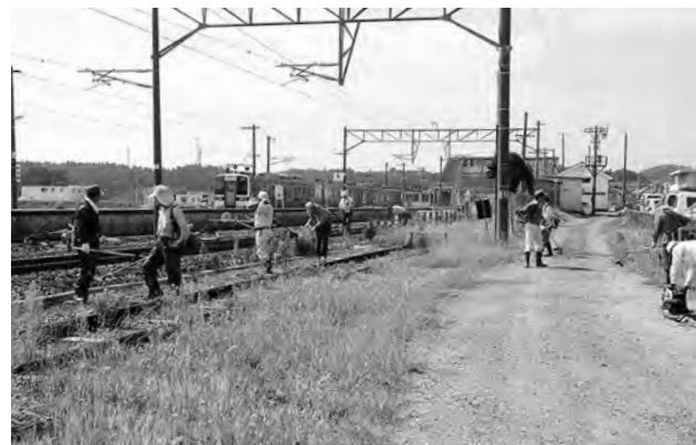
↑広野駅周辺での美化活動の様子

9月6日（土）、広野駅周辺での美化活動が行われました。厳しい残暑の中、広野駅環境美化推進協議会の会員を中心に、婦人会、企業、鉄道関係者や町職員など約50人が、駅構内や駅前広場などの除草作業に汗を流しました。