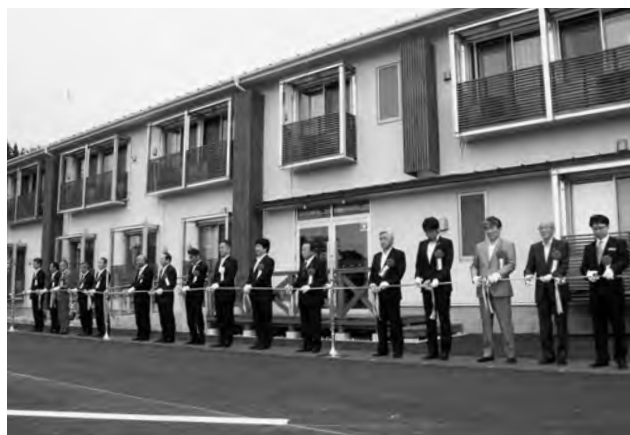
↑「ホテルリーブス」オープニングセレモニーの様子

広野町は、8月30日（土）に町内大字下北迫地内で広野町仮設宿泊施設「ホテルリーブス」のオープニングセレモニーを開催しました。