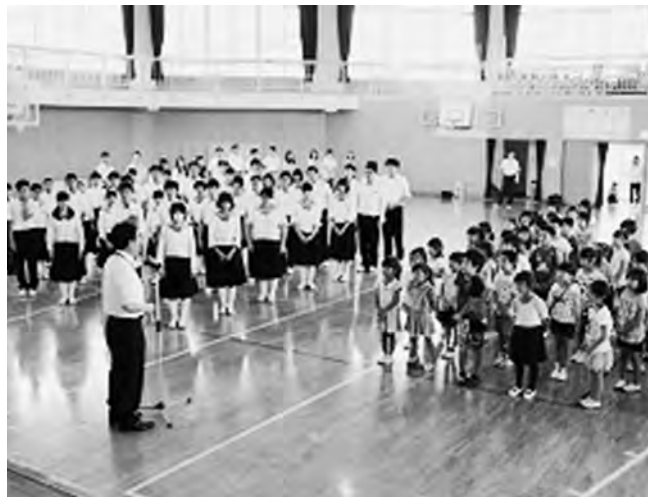
↑中学生と小学生との対面式の様子

広野中学校の生徒は、中学校の校舎が県立中高一貫校「ふたば未来学園高校」の受け入れ準備に入ったため、第2学期から広野小学校の校舎で勉強しています。8月25日（月）は、広野小学校の体育館で始業式の後、同じ校舎で生活を共にする小学生との対面式を行いました。