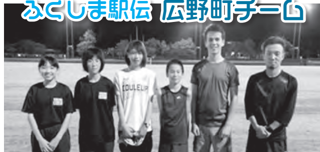
(9月17日(水)の練習にて) 総合グラウンドでの定期練習は、毎週月・水曜日18時からです！

ふくしま駅伝広野町代表チームは、11月の駅伝本番に向けて練習に励んでいます。昨年は前半のみの出場となりましたが、今年は今シーズン出場を目指しています。そのため現在も引き続き選手の募集をしています！走るのが好きな方、ちよっと駅伝を走るのには自信がないなという方もぜひ一度、練習にご参加ください。