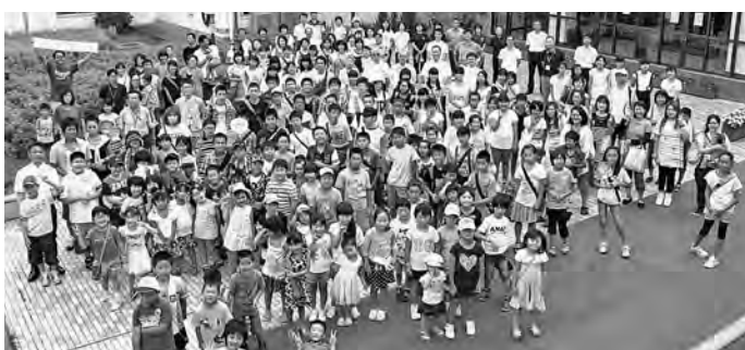
広野町再会・交流事業「集まれ!!ひろのっこ」

9月8日に中学生、9月9日に 中学校教職員との懇談会 を開催し、率直な意見・要望を聞きました。その際の要望等につきまして、改善に努め、生徒たちの学習環境のさらなる充実を図ってまいります。また、今後は 保護者との懇談会 も実施してまいります。