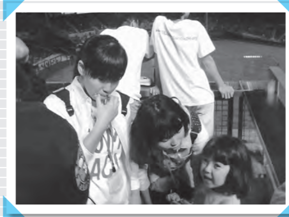
23日(火) 大リーグ野球のサンディエゴ・パドレス対 コロラド・ロッキーズ戦を観戦(ベトコパーク)