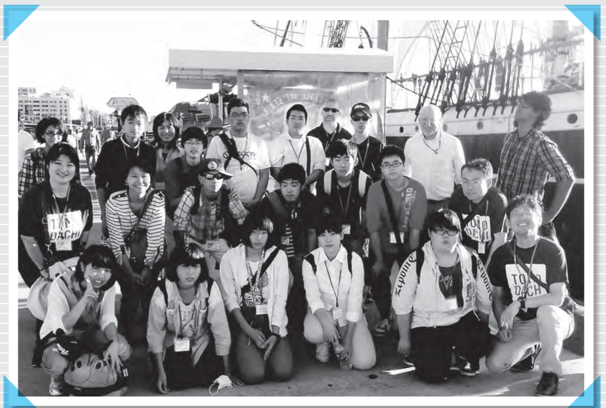
現地2日目の24日(水)に帆船カリフォルニア号でクルージング体験