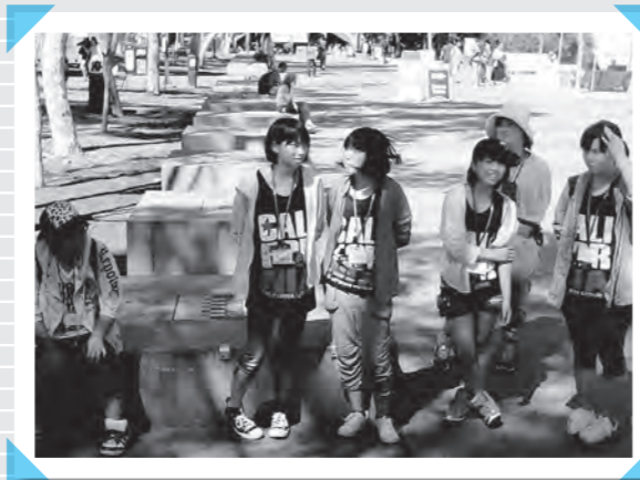
25日(木) 現地の大学を訪問 (カリフォルニア大学サンディエゴ校)