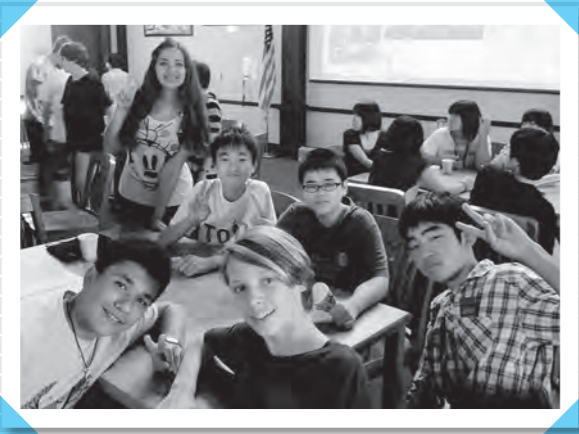
26日(金) 現地の高校の授業に参加 (サン・ティギート高校)