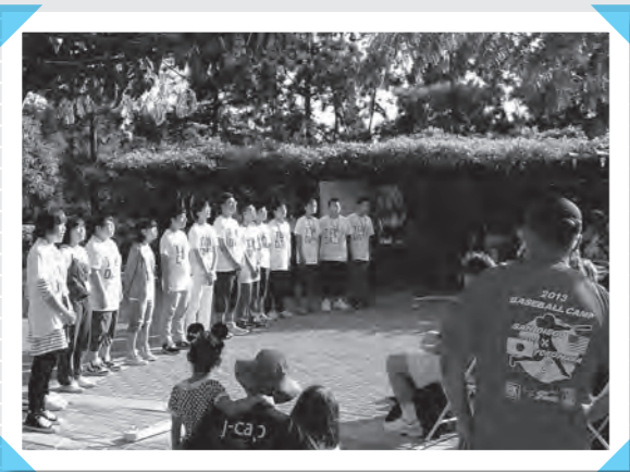
28日(日) クロージング・セレモニーで合唱披露 (サンディエゴ日本友好庭園)