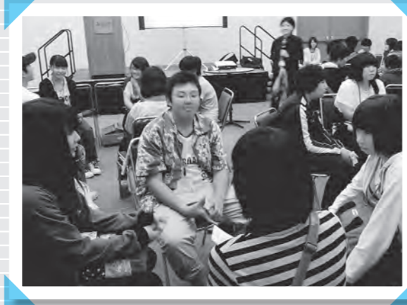
24日(水) 万次郎+ホイットフィールド・ワークショップ (サンディエゴ・コンベンション・センター)