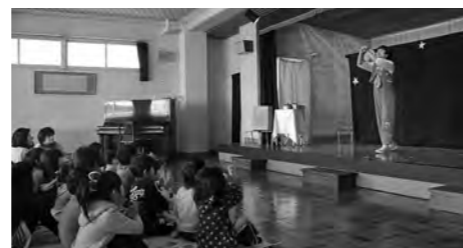
↑「パントマイム」に子どもたちも興味津々

平成25年度「ふくしま次代を担う子どもの文化芸術体験事業」の一環として、「チカパンのパントマイム」が平成25年12月13日（金）、広野幼稚園で開催されました。動物や窓の開け方などの表現の仕方を教えてもらったり、チカパンのいろいろなパフォーマンスを楽しみました。