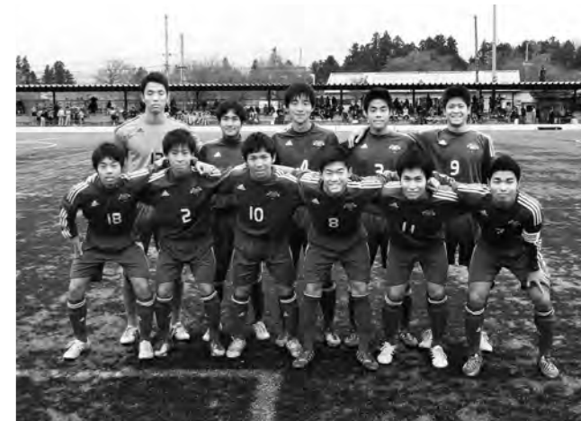
↑JFAアカデミー福島の選手のみなさん