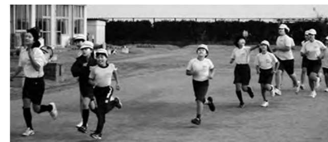
↑ゴールを目指し、みんな頑張りました

校内持久走大会が平成25年12月4日（水）、広野小学校校庭で行われました。当日は、これまでの練習の成果を発揮して、1・2年生は800m、3・4年生は1000m、5・6年生は1200mを走りました。