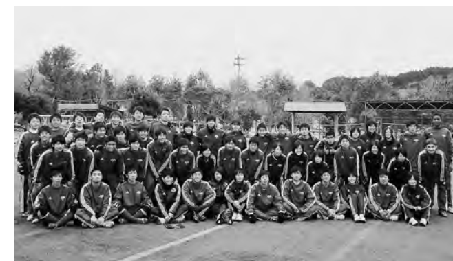
↑ JFAアカデミー福島のみなさん