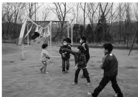
↑力いっぱい豆まきをして鬼を退治しました

鬼に力いっぱい豆をぶつけて、泣き虫鬼、おこりんぼ鬼を退治しました。あとは福が来るだけです。