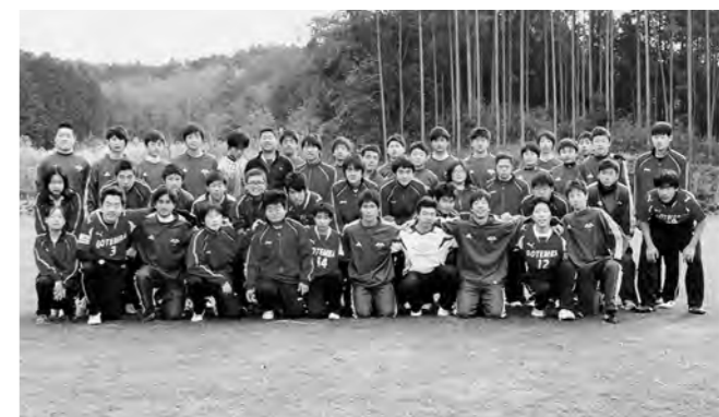
↑JFAアカデミー福島のみなさん