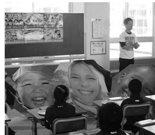
↑「笑顔の皿」作成の説明を受ける子どもたち

「ふくしまっ子10万人の笑顔プロジェクト」が平成26年2月5日（水）、広野小学校で行われました。これは、福島県内民放4社の共同キャンペーンで、東日本大震災から3年目にあたって、未来を担う子どもたちの夢と希望を応援するためのものです。