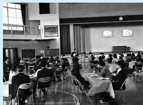
↑福島県双葉郡子供みらい会議の様子

このような貴重な体験をさせていただいた御殿場特別支援学校の皆様に感謝しています。