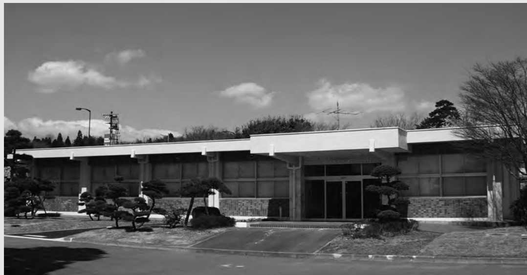
富岡労働基準監督署臨時事務所が開設される二ツ沼総合公園内パークギャラリー