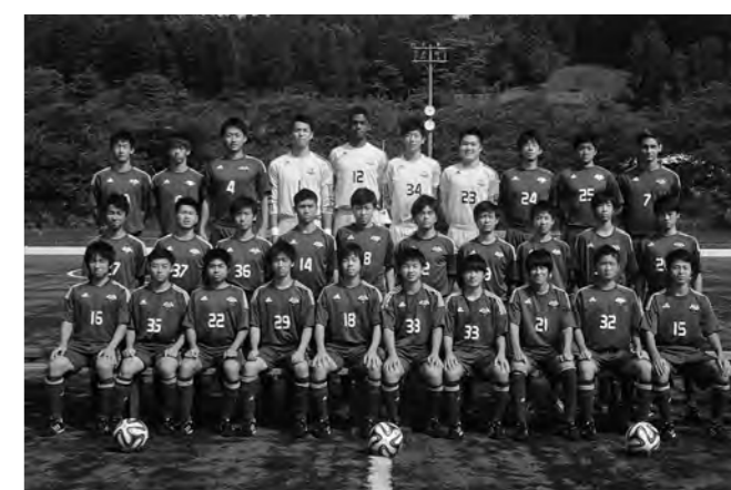
↑プレミアリーグで戦うJFAアカデミー福島メンバー