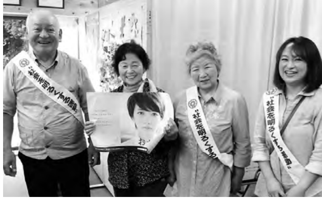
↑ 応急仮設住宅で犯罪防止の呼びかけを実施

7月10日（木）「社会を明るくする運動」の街頭活動のため、広野町担当保護司と広野町更正保護女性会の代表者が広野町の応急仮設住宅を訪れ、犯罪防止の呼びかけなどを行いました。