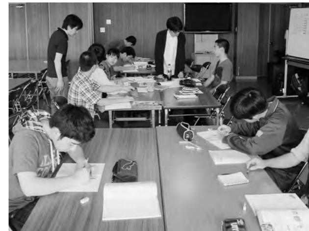
↑ 町営学習塾の様子

平成27年2月まで、土曜日、日曜日、夏休みなどを利用し、全部で25日間開講します。初日は、広野中の生徒8人が、4人の大学生から指導を受けながら、6時間みっちり勉強しました。