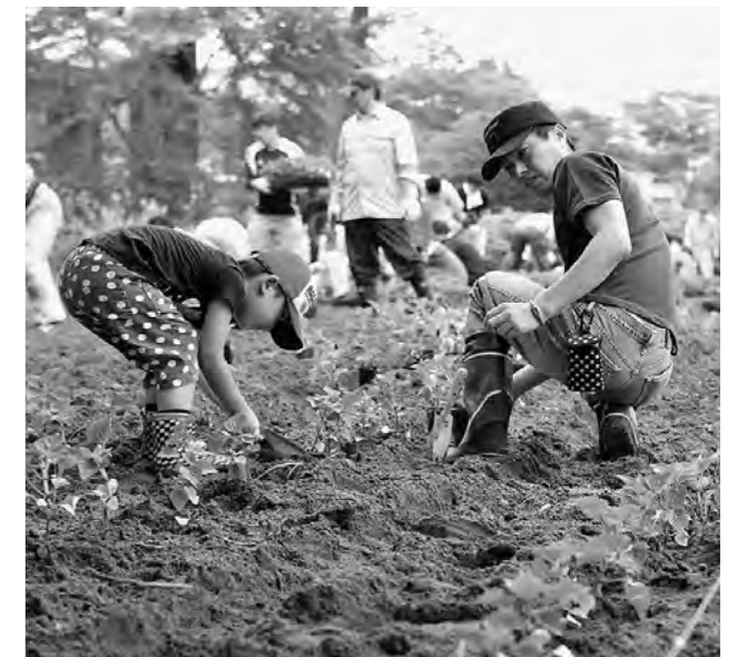
↑ 花いっぱい運動の様子

7月5日（土）、ニッ沼総合公園で東日本大震災後初の花いっぱい運動を行い、町民と職員とが参加しました。参加者は3か所に分かれて、マリーゴールドやサルビアの苗木を植えました。花壇は、黄色、だいたい色、赤の3色に染まりました。