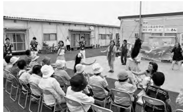
↑ 観客も参加した「Mauloa Laulea」のフラ

7月13日（日）、勿来工業高校フラ愛好会「Mauloa Laulea」が、いわき市中央台第四応急仮設住宅集会所前で、フラやタヒチアンダンスを演技し、来月出場するフラガールズ甲子園の課題曲などを披露しました。