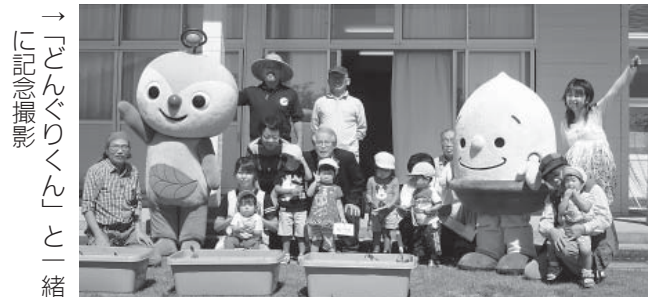
↑「どんぐりくんと一緒に記念撮影」の様子