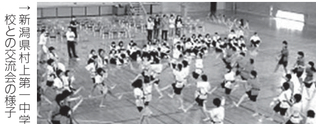
↑新潟県村上第一中学校との交流会の様子

震災後から継続して交流している新潟県村上市立村上第一中学校の生徒との交流会が8月2日(金)、広野中学校で行われました。