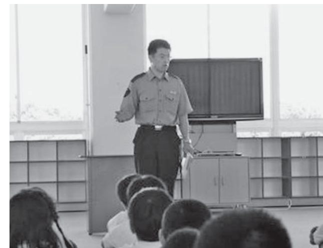
↑交通安全教室の様子