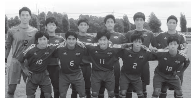
↑アカデミー福島イレブン