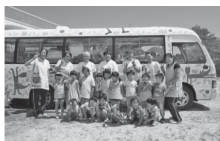
↑ハッピー・プレイバスの前での記念撮影

8月27日に、イケア・ジャパン(株)の支援活動で、たくさんの遊具をつんだバスがやってきました。遊戯室にたくさんの遊具をならべていただき、子どもたちは、好きな遊具を見つけて思い切り遊びました。小さなぬいぐるみのプレゼントもあり、大喜びでした。