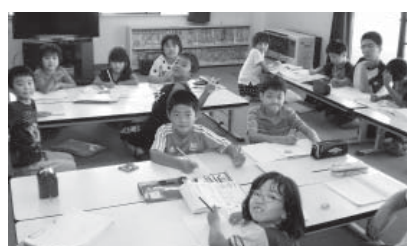
↑みんなで楽しく勉強しています

2学期が始まり、子どもたちは小学校から元気に帰ってきます。「たがいま」、「お帰り」毎日のあいさつに心が一つになります。