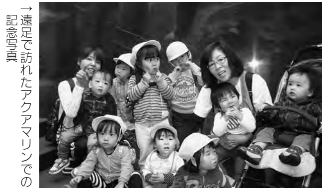
→遠足で訪れたアクアマリンでの記念写真

保育所の子どもたちは10月22日(火)、秋の遠足で「アクアマリンふくしま」を訪れました。