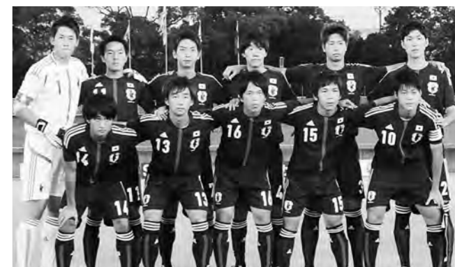
↑U-18サッカー日本代表の選手たち