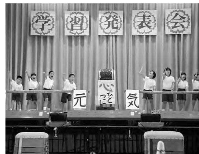
↑学習発表会の様子

平成25年度広野町立広野小学校学習発表会が、10月5日(土)に広野小学校体育館で開催されました。