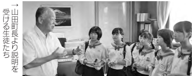
→山田町長より説明を受ける生徒たち

広野中学校の生徒が9月19日(木)、20日(金)の2日間、総合学習の一環として校外体験学習を行いました。