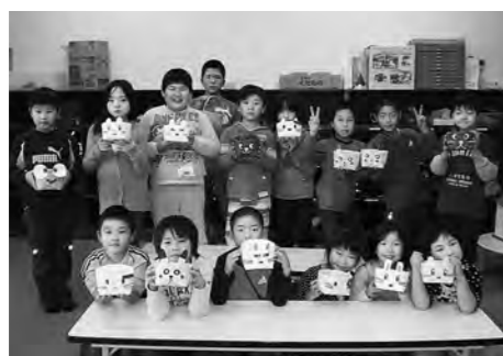
↑オリジナルの小物入れを差し出す子どもたち

児童館の子どもたちは11月1日（金）、ボランティアの方々と一緒に今人気のエコクラフトにチャレンジしました。お気に入りのキャラクターや動物の顔をつけ、一生懸命作業をしました。小物入れに何をいれるか子どもたちも楽しみです。