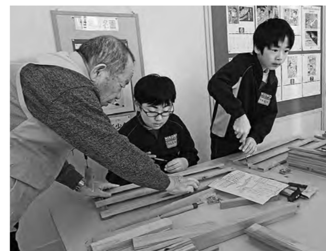
↑一生懸命プランター入れづくりをする子どもたち

木工教室が11月11日（月）から14日（木）にかけて行われ、4年生と6年生が木工教室に取り組みました。4年生は、最初に森林の大切さを教えていただいた後、のこぎりや切り出しナイフなどの使い方を教わり、実際に自分で木の枝や木の実、木片などを使ってかわいい置物やアクセサリーなどを作りました。また、6年生は、花を植えるプランター入れ作りに挑戦しました。設計図を見ながら、かなづちや釘を使って板を打ち付けて形を作っていくのが難しかったようですが、それぞれ思い思いの作品が仕上がることができました。