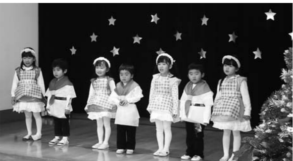
▲保育所・幼稚園のおゆうぎ会の様子

すでに通園先を通じて4月～7月分までの申請をいただいた方には、補助金交付決定通知書を送付した上で振込みをいたしましたので、通帳でもご確認ください。