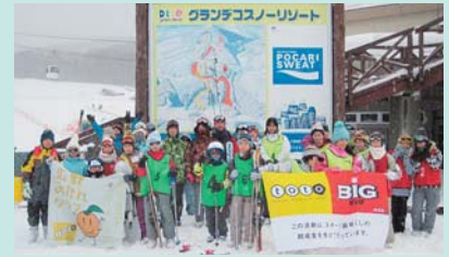
実施場所：グランアコスノーリゾート

▽実施日 2月16日(土) ▽参加人数 スクール 14名 自由滑走 14名 合計 28名