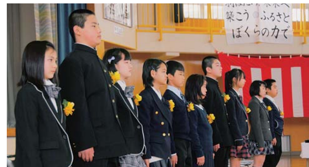
卒業を迎えた10名の児童

広野小学校卒業式が3月22日、小学校体育館で行われました。この日晴れて10名の児童が卒業式を迎えました。いわき市立中央台南小学校との合同運動会や学習発表会などでは、下級生を引っ張り、堂々と力強い姿をみせてくれました。それぞれが不安を抱えながらも決して下を向くことなく笑顔で前を向いて頑張った10名の児童のみなさん、卒業おめでとうございます。