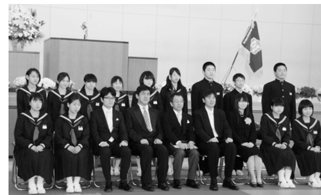
新入生のみなさん