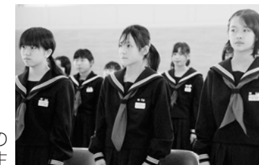
緊張した面持ちの新入生