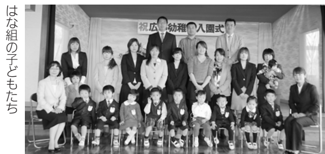
はな組の子どもたち