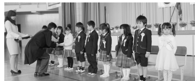
新入学児童に教科書を手渡す様子