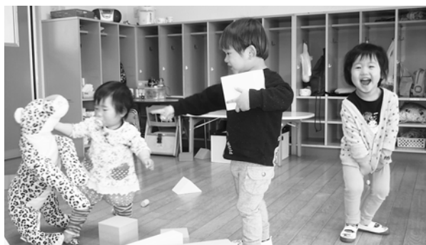
元気に遊ぶ子どもたち