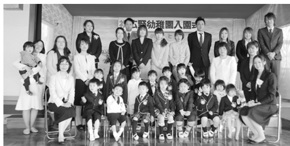
つき組の子どもたち