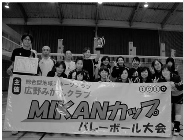
▲男女混合の部で優勝した「Field」のみなさんと女子の部で優勝した「スマイル広野」のみなさん