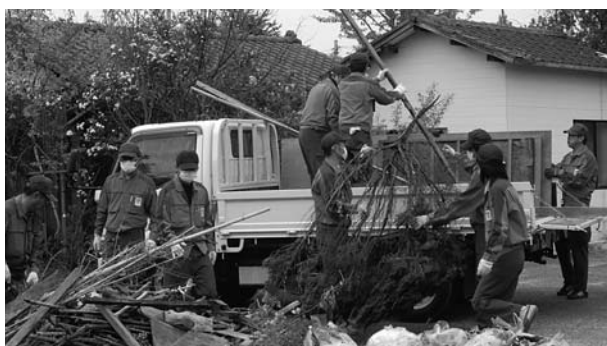
▲ガレキなどの搬出を行う東京電力㈱社員

町営住宅入居者が安心して帰町できるよう、町営住宅敷地などの清掃作業を東京電力㈱職員により5月14日から約1カ月の期間で実施しています。