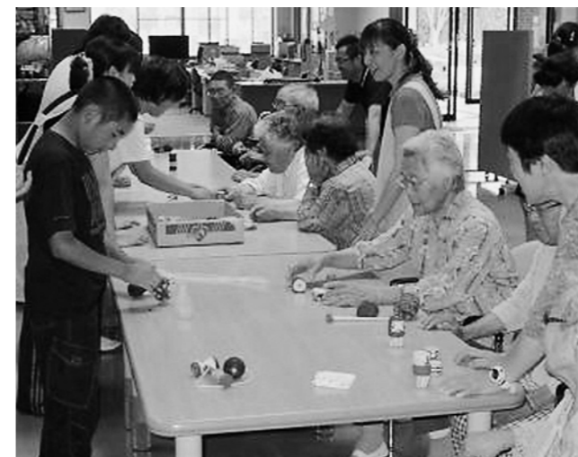
↑ご年配の方々に教えてもらいながら遊ぶ子どもたち