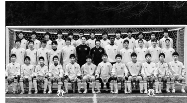
↑JFAアカデミー福島のみなさん