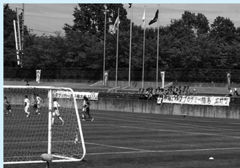
↑昨年度のJFAアカデミー福島の試合の様子

たくさんの方々に感謝の気持ちを忘れず自分たちのサッカーで恩返ししていきたいと思っております。これからもJFAアカデミー福島の応援をよろしく願います。