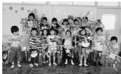
↑自分で作った七夕飾りと記念写真

子どもたちは、願いごとを書いて自分の七夕飾りをつくり、織姫と彦星のお話を聞いたりして楽しく過ごしました。