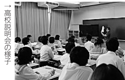
→高校説明会の様子

各高校からは校長先生や教頭先生が講師として来校され、現在の生徒の様子や進路状況など具体的な実績についてお話しがありました。