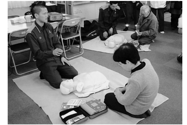
↑ 仮設住宅でAED講習をする消防職員