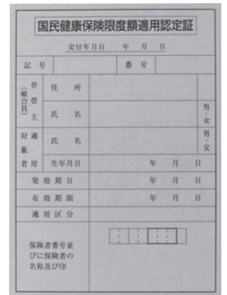
限度額適用認定証→