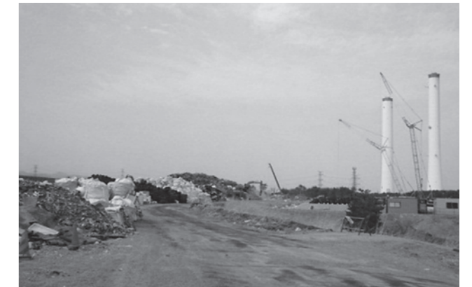
↑決められたものを搬入してください 町民のみなさんの協力が必要です