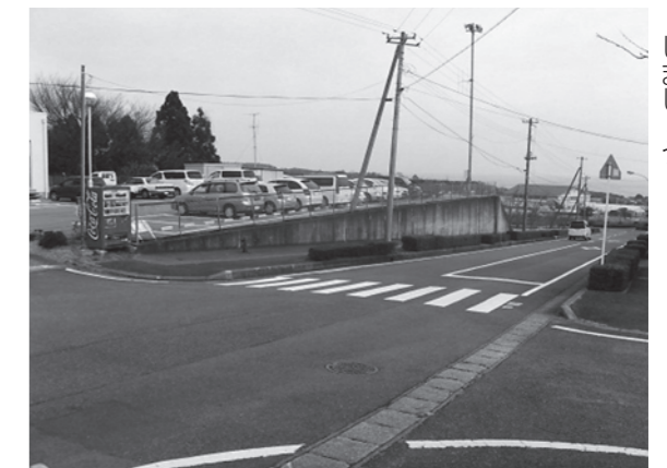
←左右の安全を十分確認してから横断 しましょう