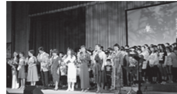
←第18回ひろの童謡まつりの様子