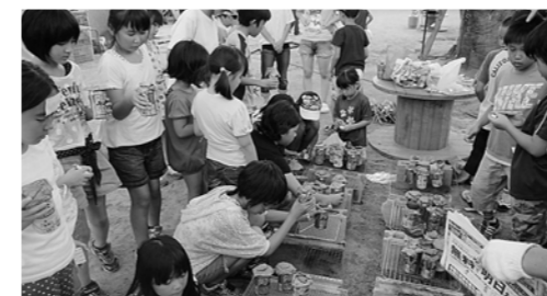
↑空き缶でお米を炊く子どもたち