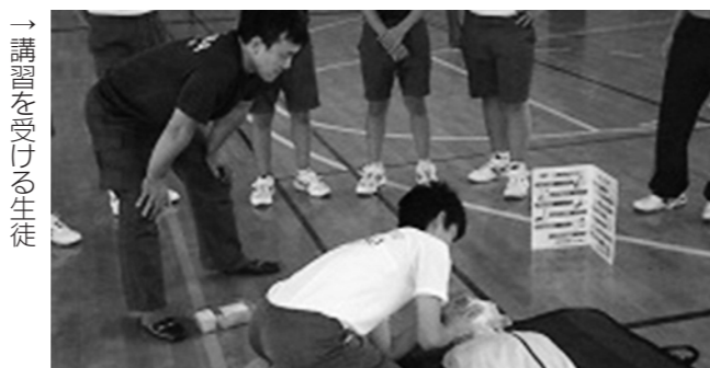
→講習を受ける生徒

救急救命講習が7月18日(木)、全校生を対象に行われました。双葉消防署榎葉分署の署員4名の方々に講師をしていただき、救急救命の基礎知識について、説明をしていただきました。