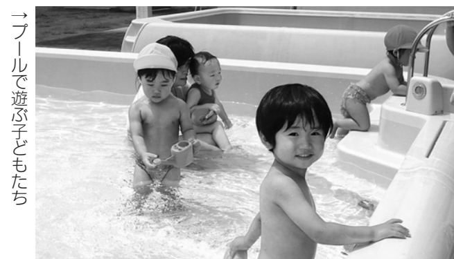
→プールで遊ぶ子どもたち

保育所では、8月9日、大きなプールでのプール開きを行いました。子どもたちは新しい大きなプールでの水の感触を楽しんでいました。