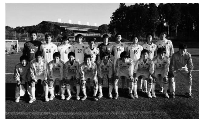
↑JFAアカデミー福島3期生のみなさん