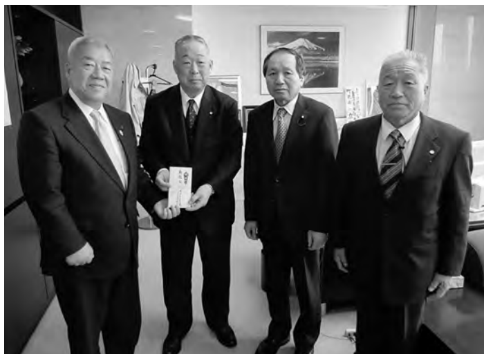
▶左から三郷市長、町長、議長、副議長