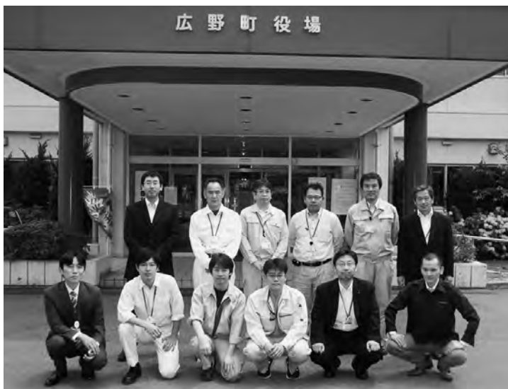
▶全国から応援をいただいている職員のみなさん

【応援をいただいている自治体および 国の機関(順不同)】 福島県、埼玉県三郷市、宮崎県宮崎市、愛知県清須市、岐阜県岐阜市、経済産業省、経済産業省北海道経済産業局、内閣府、農林水産省