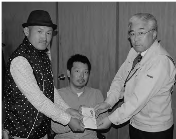
▶国井さん(左)、根本さん(中)、副町長(右)