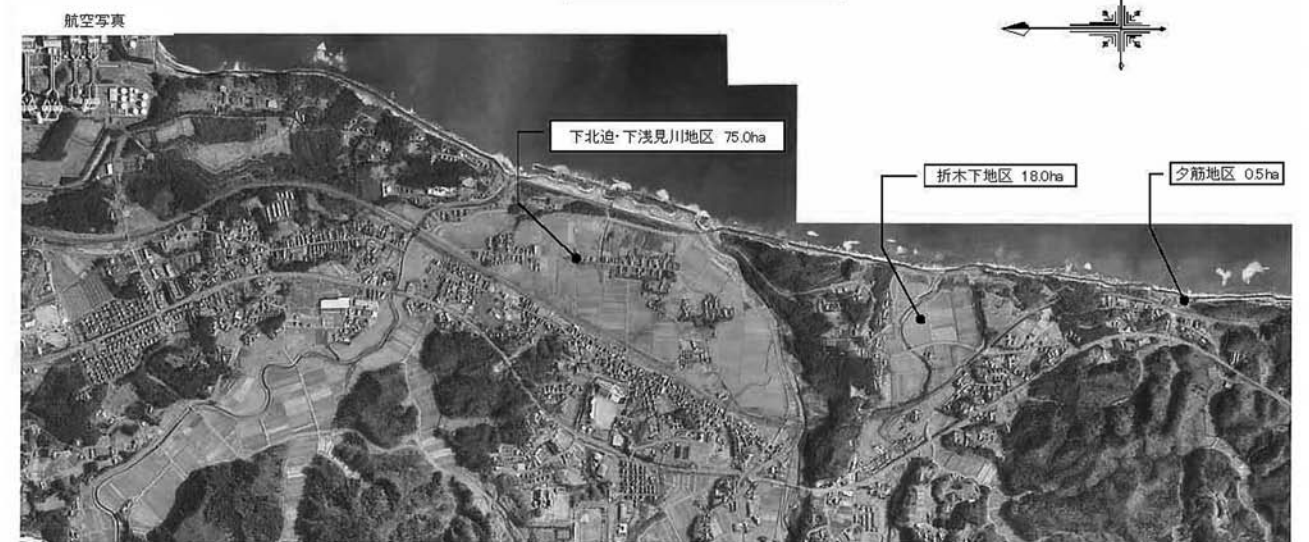
広野町津波被災区

申込書に必要事項を記入の上、郵送または企画グループ窓口までお持ちください。 ※申込用紙は、企画グループ窓口にお越しいただくかまたはホームページよりダウンロードしてください