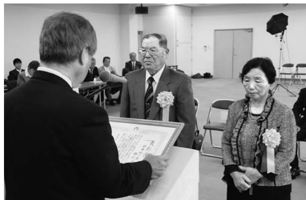
平成23年度金婚式の様子

町では、広野町金婚祝に関する規程に基づき、結婚50年を迎えるご夫婦に金婚祝として額入祝状と額入記念写真を贈呈しております。 つきましては、平成24年に金婚を迎えられるご夫婦(昭和37年に結婚されたご夫婦)は、金婚祝の申込受付を行いますので、次の事項にご留意の上お申込みくださるようお知らせいたします。