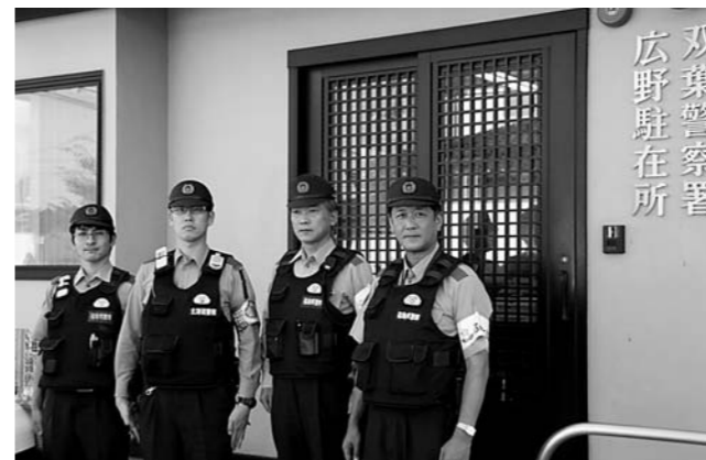
広野駐在所のみなさん

広野町の復旧・復興のため、地域住民に寄り添います。地域の安全・安心のために精一杯がんばります。