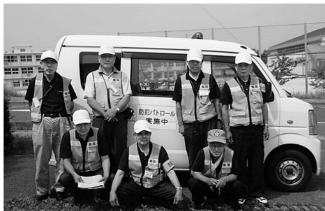
警戒パトロール隊のみなさん