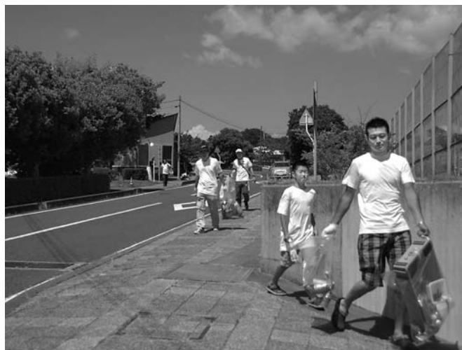
▲環境美化に貢献した参加者

広野がんばっ会は、9月30日に子育て世代の親を対象に放射線と健康に関する講演会を開催する予定です。