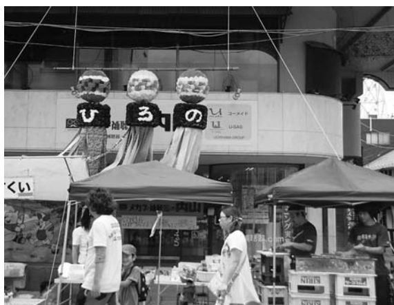
▲「ひろの」の文字の入った七夕飾り