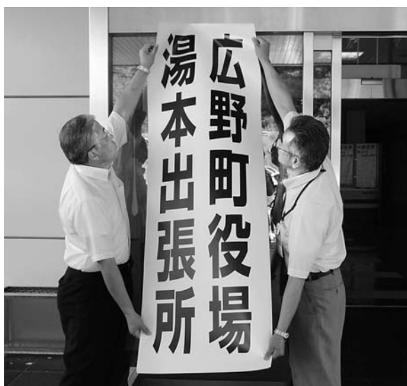
▲看板をはずす職員