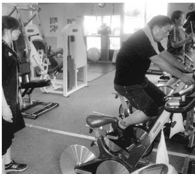
▲トレーニングの様子