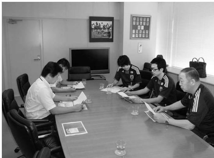
▲サッカー協会訪問の様子