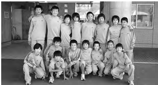
▲JFAアカデミー福島7期生のみなさん

静岡県御殿場市に避難しているJFAアカデミー福島の7期生が、10月20日、初めて広野町を訪れました。