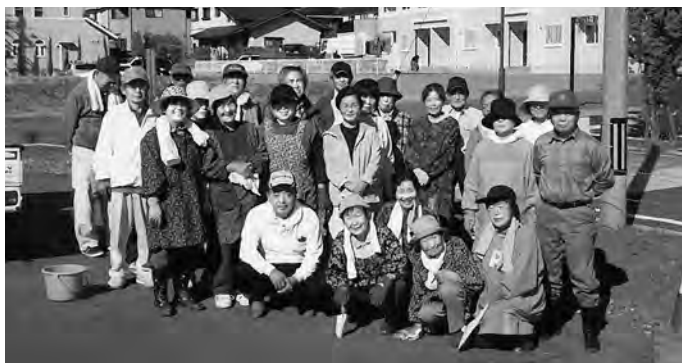
▲参加者のみなさん

中央台高久第2 応急仮設住宅の入居者のみなさんが、10月20日にNPO法人から提供のあったチューリップの球根を敷地内に植えました。入居者の方は、「きれいな花が咲き、みんなの心が少しでも癒されるよう手入れしていきたい」と話していました。