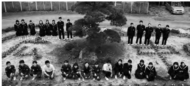
広中と描かれた花々の 周りに集まる中学生