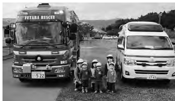
▲消防車の前での記念撮影