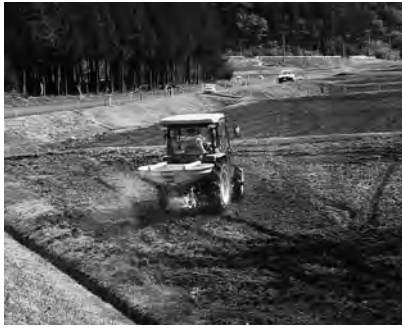
▲ゼオライトの散布

セシウムはケイ酸カリと性質が似ており、土壌にカリ肥料が不足すると、農作物は、代わりにセシウムを積極的に吸い上げてしまう恐れがあるため、それを防ぐために農地にゼオライト・ケイ酸カリを散布し、土壌改良をします。ケイ酸カリの施用量は10aあたり30kgを目安としております。