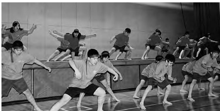
▲中学生全員によるソーラン節