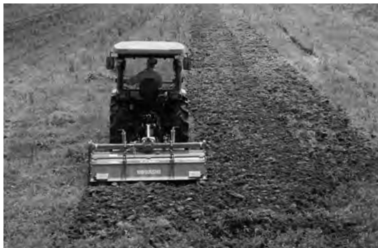
▶トラクターでの深耕の様子