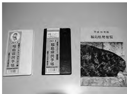
▲福島県民手帳と県勢要覧