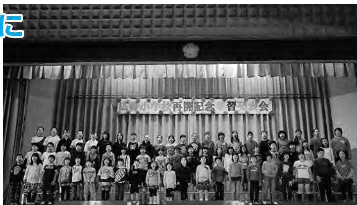
▲小学生全員による合唱

閉幕の言葉の中で6年生の代表者は、「広野町でまた、学習発表会ができてうれしい」と喜びをかみしめていました。