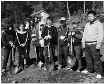
▲森林体験学習に参加した子どもたち