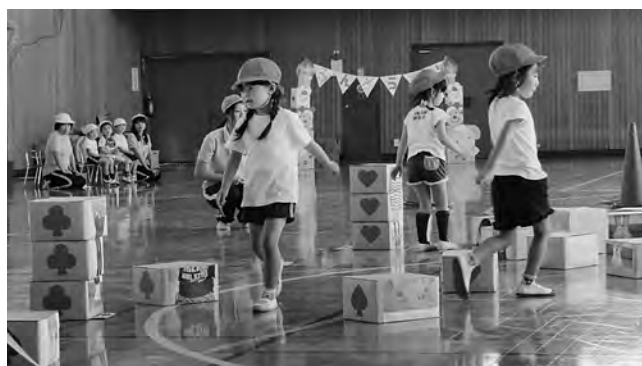
▲幼稚園・保育所合同運動会の様子