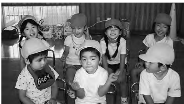
▲笑顔いっぱいの広野っ子