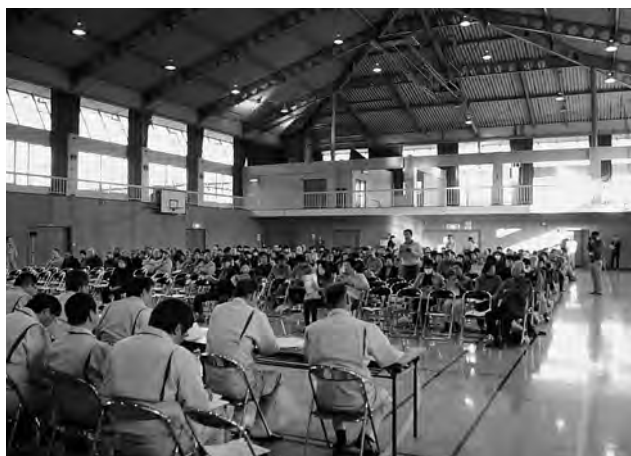
▲帰還に向けた住民説明会の様子