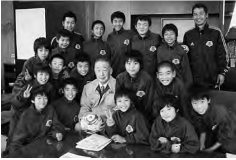
▲初めて広野町を訪れたアカデミー7期生

平成24年11月12日現在、広野小学校は64名、広野中学校は32名、広野幼稚園は4名の児童生徒がそれぞれ通学・通園しています。