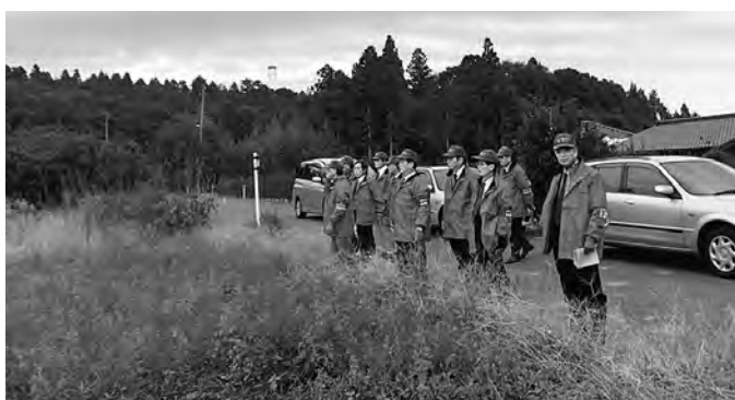
▲農地パトロールの様子