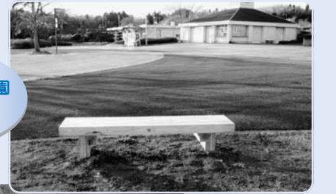
二ツ沼総合公園 ベンチ 3基

森林環境交付金事業として、県産間伐材を使用した木製テーブルと木製ベンチが、五社山展望台と二ツ沼総合公園に設置されました。ご利用ください。