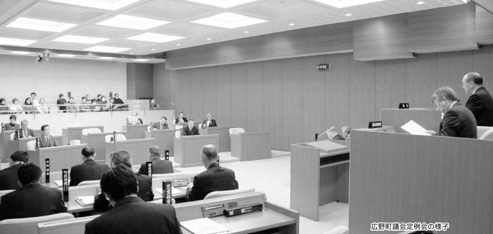
広野町議会定例会の様子

れ、出演者と来場者を合わせて約800名の参加を得て盛会裏に終了することができました。