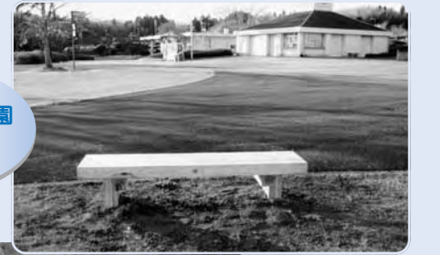
二ツ沼総合公園 ベンチ 3基

森林環境交付金事業として、県産間伐材を使用した木製テーブルと木製ベンチが、五社山展望台と二ツ沼総合公園に設置されました。ご利用ください。