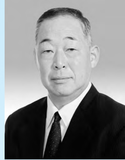
広野町長 山田 基 星

豊かな自然環境を守り、 文化と教育をはぐくみ、 明日に夢と希望の持てるまちづくり