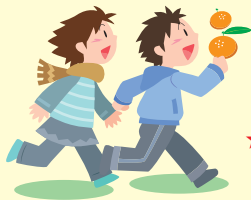
★たくさんみかんが なってるネ！