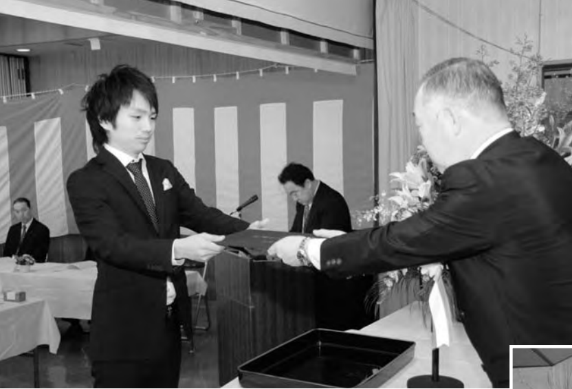
黒田さんに成人証書が手渡される