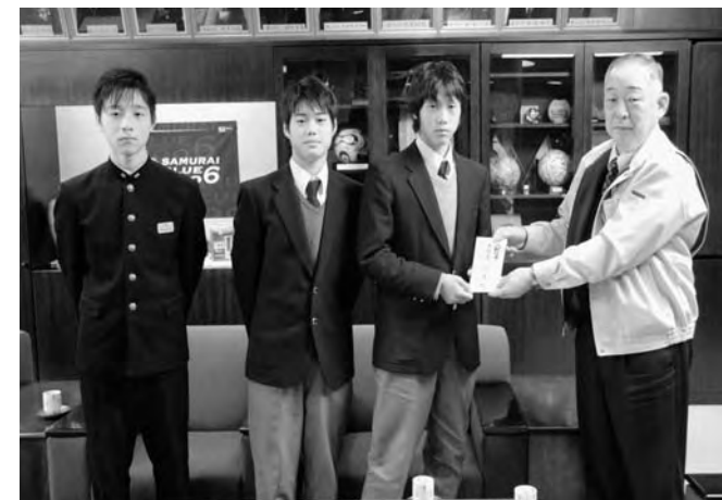
▲右から、町長、古山選手、松本選手、早坂選手

JFA アカデミー福島3選手が大会の成績や個人の今後について報告に町長室を訪れました。