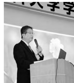
2010年文化功労者の藤嶋先生による講演

交換を行いながら町づくりやPR活動を展開して参ります。児童生徒への科学技術および理科に対する興味関心を高め、学習意欲の向上を図ることを目的に、去る10月1日、広野町中央体育館において、町制施行70周年記念特別行事として、東京理科大学学長の藤嶋昭先生をお迎えして「研究は感動することから」と題した講演会を開催いたしました。