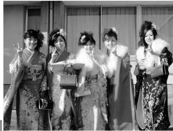
友人と久しぶりの再会で記念写真