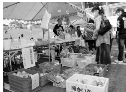
広野町産の野菜などが並んだ収穫祭

11月6・7日の両日に、公民館前駐車場において、第13回収穫祭を各団体のご協力をいただき開催いたしました。