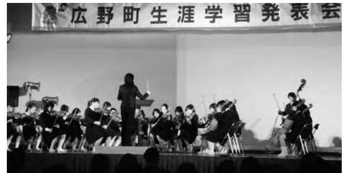
▲広野小学校器楽部の演奏