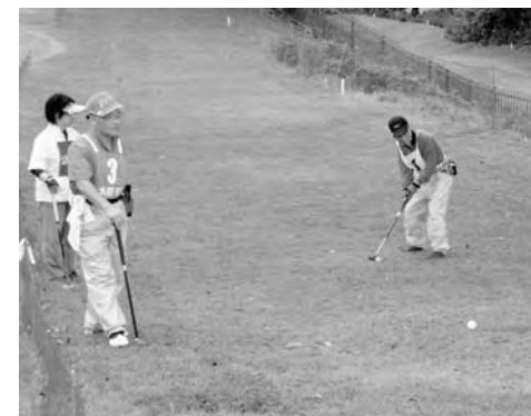
優勝を飾ったパークゴルフ広野町チーム

9月19日から第3回市町村対抗軟式野球大会が県下59市町村全ての出場のもと福島市あずま球場で開催されました。本町は、ドリームチーム編成のもと、初戦桑折町を8-1、2回戦福島市を3-1、3回戦郡山市を2-0で下し、惜しくも準決勝の田村市との対戦において1-2で惜敗しましたが、3位と言う好成績を残すことができました。この間、県下に広野町の名声を何度となく轟かせ、その活躍は町民に夢と感動を与えることができました。 また10月10日には、第48回双葉郡総合大会が楢葉町をメイン会場として開催され、当日は雨天のため一部競技が中止となりましたが、本町選手団は、先駆けて実施された球技部門と合わせ10種目、120名余が参加し熱戦を繰り広げました。今年度から新たな