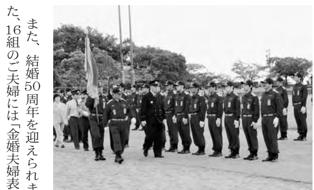
秋季検閲式の様子

した。また、11月7日には、公民館前をスタート・ゴールに、「第11回ひろの健康ウォーク」を実施いたしました。今回は、日本ウォーキング協会と健康体力づくり事業団が主催し、3年間で全国のすべての市町村でウォーキング大会を行う運動「ウォーク1800」に参加をして実施いたしました。町民の方のもとより、県内各地から約200名の参加をいただき、秋の景色を楽しみながらウォーキングを実践し、健康づくりを推進いたしました。