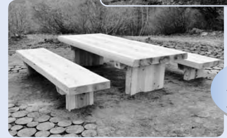
五社山展望台 テーブル 1基 ベンチ 2基