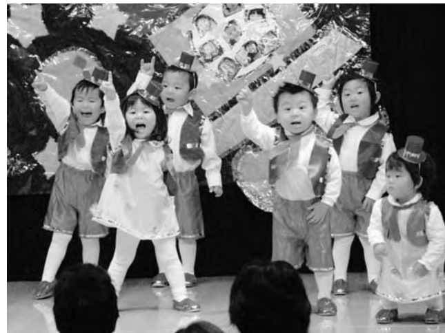
▲おゆうぎ会の様子

クリスマスおゆうぎ会が12月3日、保育所で開かれました。かわいらしいダンスを踊る子どもたちに会場からは、たくさんの笑顔と拍手が送られていました。