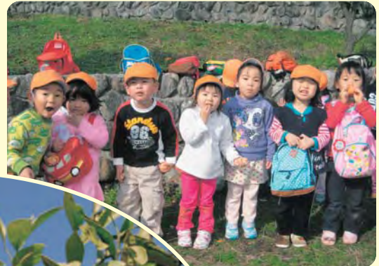
★おいしく いただきました