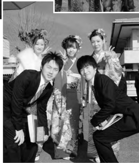
互いの成人を祝う皆さん