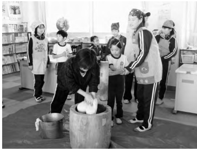
▲協力してもちをつく子どもたち

当日、1年生全員も招待を受け、5年生のお兄さん、お姉さんと一緒にきねを持って餅つき体験。つきあがった餅は、きな粉餅、じゅうねん餅にいただきました。自分たちで収穫したもち米を口いっぱいにお張っていました。