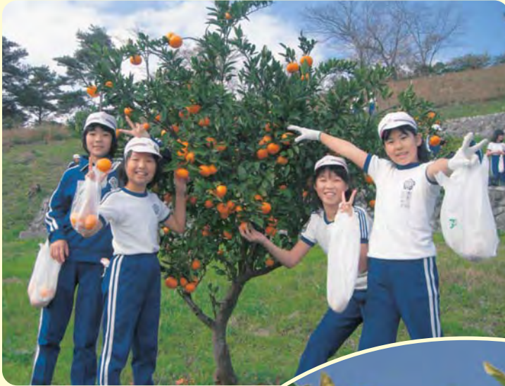
★笑顔でみかんを手にする児童