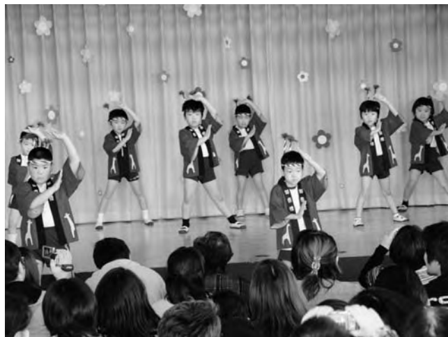
▲決めポーズの園児たち

生活発表会が12月11日、幼稚園で行われました。子どもたちはダンスや歌などを楽しそうに歌いました。会場では子どもたちの成長した姿をカメラにおさめようとたくさんの家族の姿が見られました。