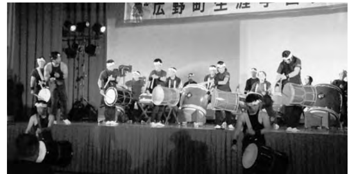
▲日ごろの稽古の成果を披露