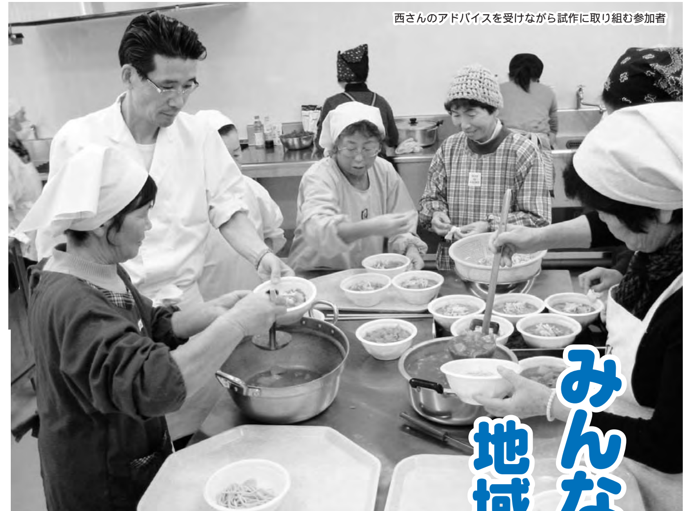
西さんのアドバイスを受けながら試作に取り組む参加者