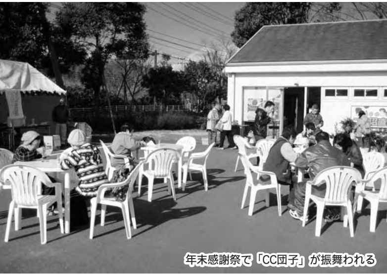
年末感謝祭で「CC団子」が振舞われる