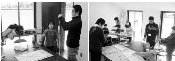
▲冬休み中の子どもたち数人が参加してくれました。