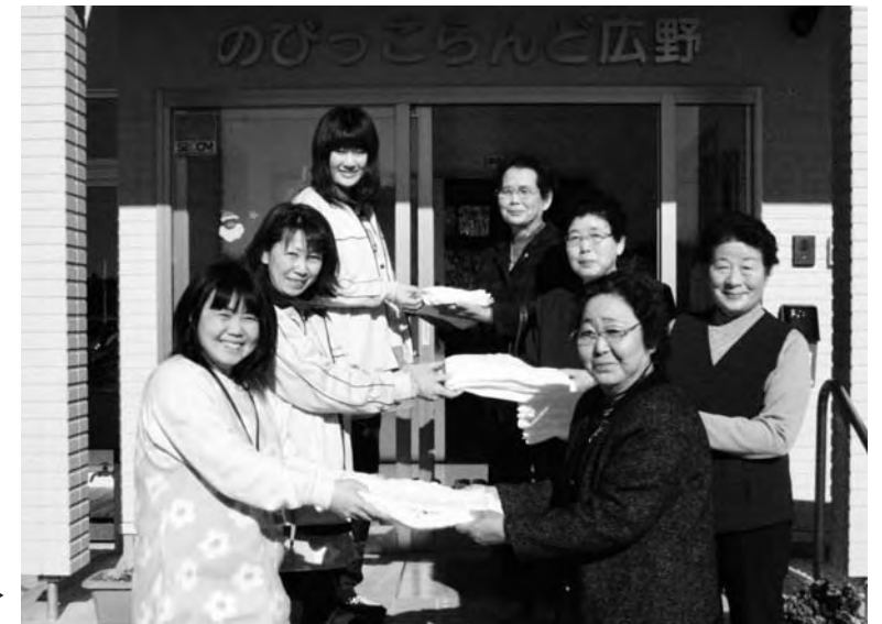
のびっこらんどへの寄贈▶

のびっこらんど、花ぶさ苑、保育所 幼稚園、小学校、中学校、児童館 老人福祉センター、広桜荘、保健センター 公民館、役場