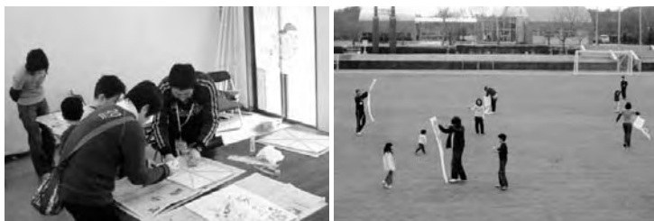
▲たこを1人で作るのなかなか難しいので、お父さん、お母さん、お友達と協力してたこづくりを行いました。