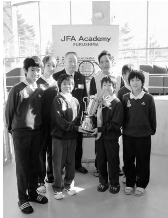
▲優勝カップが贈られました