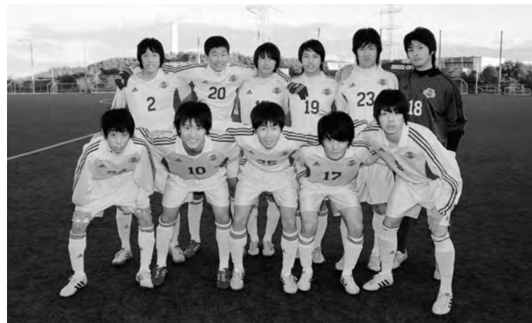
▲JFA アカデミー福島のメンバー