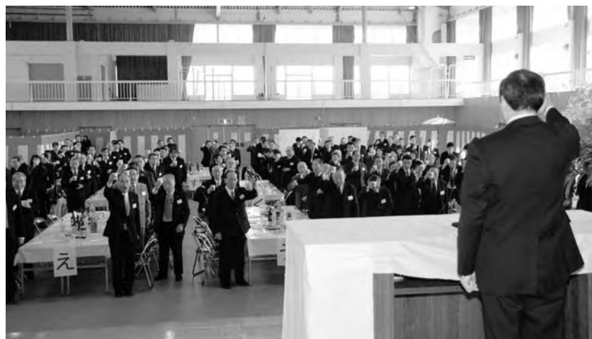
新春交歓会の様子▶

出席者は町内産のみかんを使ったジュースや小麦で作ったうどんを味わいながら親ほくを深め、町勢発展を願いました。