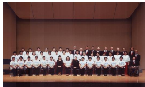
→ めじろたちとシャンテ

伊東市とは、これまで伊東市青少年合唱団との音楽交流や各種イベントへの参加など交流を深めており、今年7月には「災害時等の相互応援に関する協定書」を締結しております。