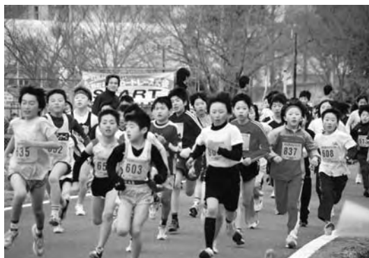
第1回みかんロードレースの様子

す総合型地域スポーツクラブが中心となり、多くの町民の皆さまが気軽にスポーツや文化活動に参加しやすい機会を拡大し、スポーツの振興や健康保持増進、生きがいづくりを、活気あふれる町づくりを推進してまいります。