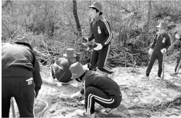
◀コナラの苗木植樹の様子

「森林教室」は「森林環境税」交付金事業の一環として、さまざまな森林の姿を学習することを目的に、毎年行われています。