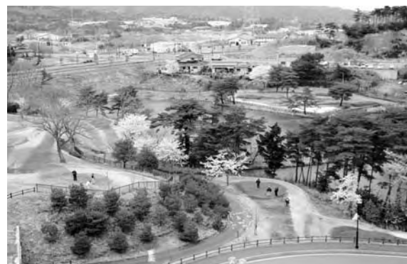
6号国道に面する観光拠点二ツ沼総合公園

地方公共団体における行財政改革の推進のための新たな指針により策定された「集中改革プラン」に基づいて事務事業の再編・整理、廃止・統合、経費節減などの財政効果