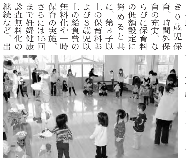
保育所で開かれたげんキッズ子育て支援

子育て支援につきましては、次代の社会を担う子どもとその家庭を支援するため、出産祝い金支給制度を始め、満15歳 中学校卒業までの医療費の一部負担金を助成すると共に、医療機関等における医療費窓口無料化を継続してまいります。また、幼稚園に入園する第3子以降の園児については、引き続き入園料、保育料および預かり保育料の全額を免除し、併せて給食費の全額を補助すると共に、保育所においても、引き続き0歳児保育、時間外保育の充実、ならびに保育料の低額設定に努めると共に、第3子以上の保育料および3歳児以上の給食費の無料化や一時保育の実施、さらには15回まで妊婦健康診査無料化の継続など、出