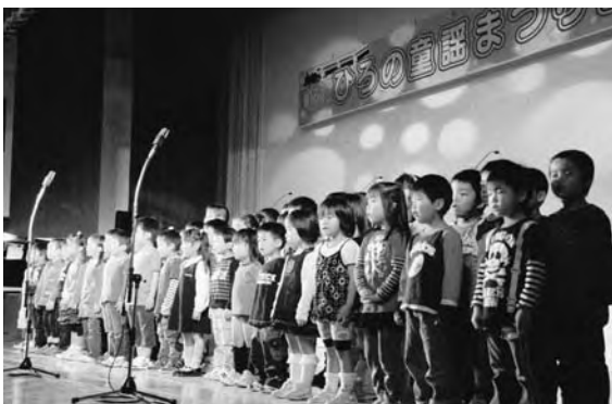
昨年のひろの童謡まつりの様子

童謡の振興と世代を超えて歌い継がれる新しい童謡の創造を目指し「ひろの童謡まつり」を開催し、童謡の町づくりを進めてまいります。