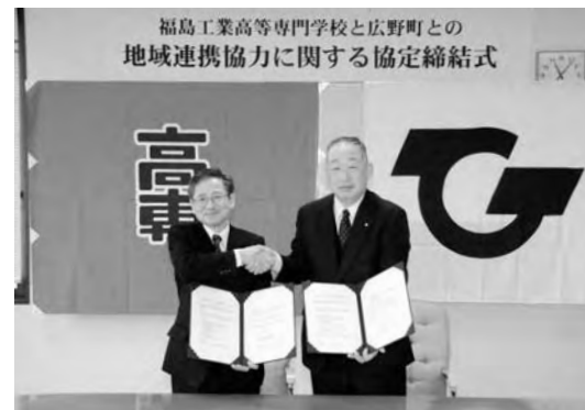
福島工業高等学校との締結式

1月7日に開催いたしました、平成22年度広野町新春交歓会には、町内から約150人の方々の参加を得て、盛會裡に終了いたしました。 また、広野町と福島工業高等学校との間で、産学官における教育、文化、産業、健康、福祉、まちづくり等幅広い分野で相互に協力し、両機関の振興発展と人材育成に寄与することを目的として、包括的な連携・協力協定を行うこととし、来る3月25日に締結・調印する予定としております。(締結式は次号掲載予定) 今後、本協定に基づき、高等教育機関の「力」をまちづくりに積極的