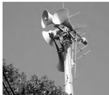
町の防災行政無線

防災対策については、安全安心な町づくりに向けて防災行政無線の改修や全国瞬時通報システムの導入を図るなど消防防災設備の充実強化に努めおり、今年度も行政・警察・地域・各種団体が協力して、防犯意識の向上に努めると共に、消防設備の充実や住宅用火災報知器の普及促進を図るための支援事業の継続、さらには防災行政無線