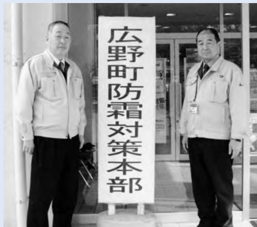
広野町防霜対策本部