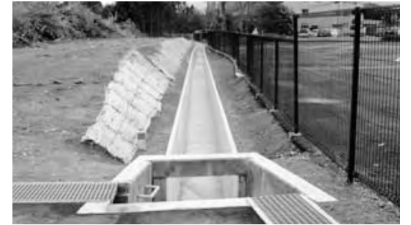
下北迫地区排水路