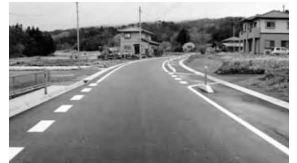
町道小松・南山線