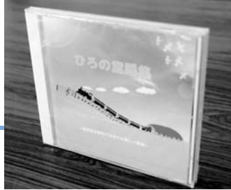
日本童謡賞特別賞を受賞したCD