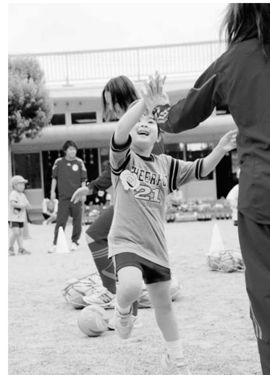
▲マリーゼ選手とハイタッチ

ウォーミングアップ後、ドリブル、シュート、ゲームなどを行い、子どもたちは元気にボールを追いかけていました。楽しいひとときを過ごしました。