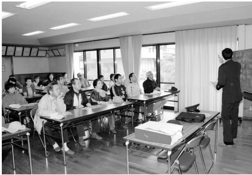
▲防犯知識について理解を深める参加者の皆さん

講和終了後には、Jヴィレッジまでをウォーキングし、カレーを食べて地域の連携を深めました。