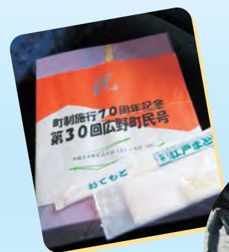
お弁当の包みにも 町制施行記念の心遣い