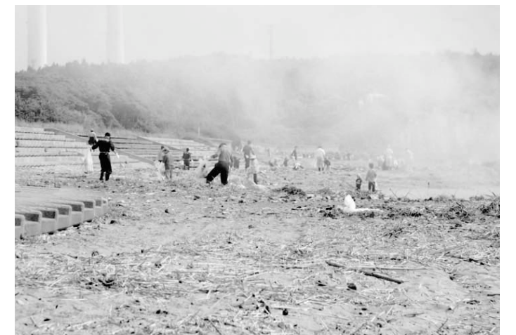
▲クリーンアップ作戦の様子