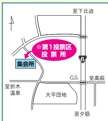
第1投票区投票所案内図