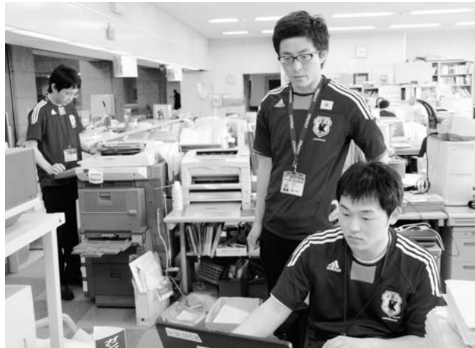
▲ユニフォーム姿の職員