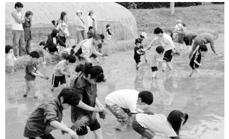
田植えに参加した皆さん▶