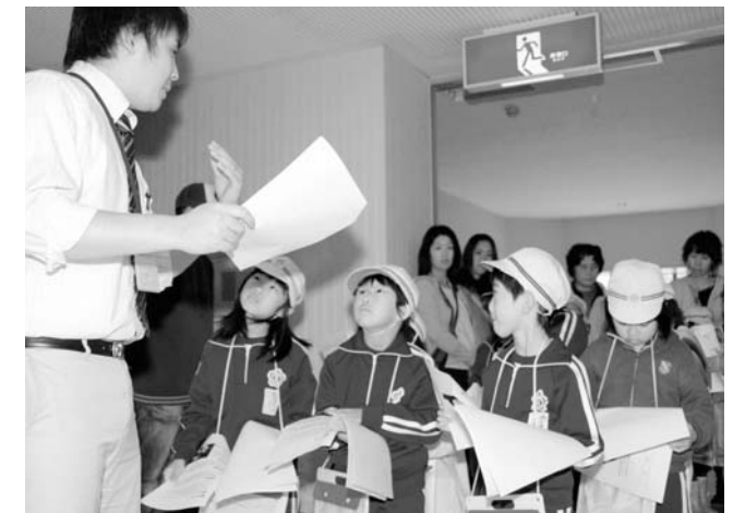
▲担当者の説明に耳をかたむける児童

広野小学校2年生による生活科の学習「町探検」が5月27日、商店街や役場内で行われました。児童たちは、町探検をし、見学を通じて広野町の様子やそこで働く人々について学習しました。