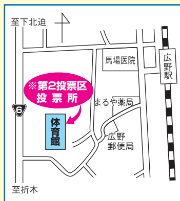
第2投票区投票所案内図