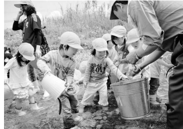
▲川に入り、アユを放流する子どもたち

浅見川愛好会は、6月4日、アユの稚魚1万匹を浅見川、北迫川、折木川に放流しました。この日は子どもたちと一緒にアユを放流しました。