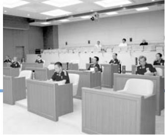
議員の皆さんもサムライブルー姿で議案審議