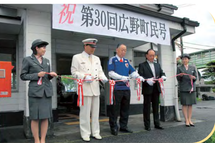
出発前テープカットの様子