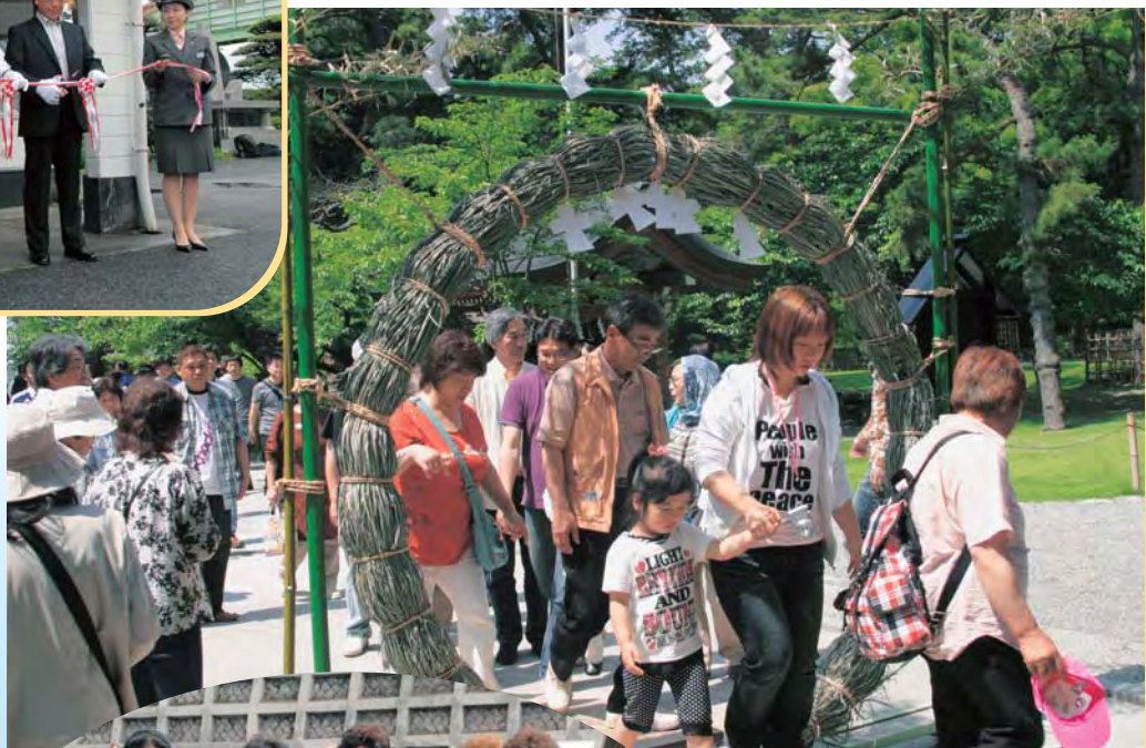
ちのわ 茅輪くぐりをして願いごとをする参加者