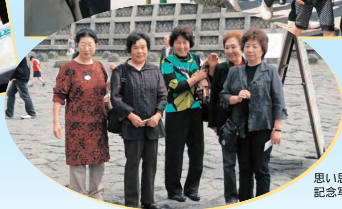
思い思いに 記念写真を撮る参加者