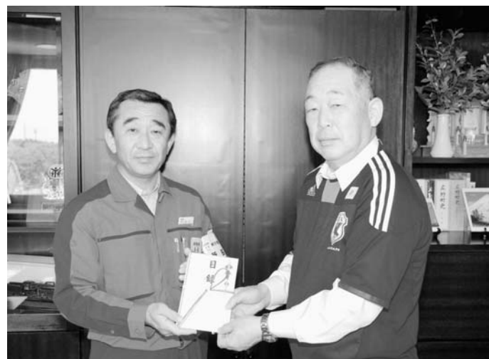
▲清水所長より町長に目録が手渡されました

サッカートレーニングセンター「Jヴィレッジ」がある広野町と榎葉町を全国にPRしようと企画されました。