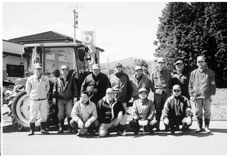
▲農業委員の皆さん

なお、耕作放棄地がある方については、耕作の有無などのアンケートを実施し、耕作放棄地の解消に推進していきます。農家の方々のご協力をお願いします。