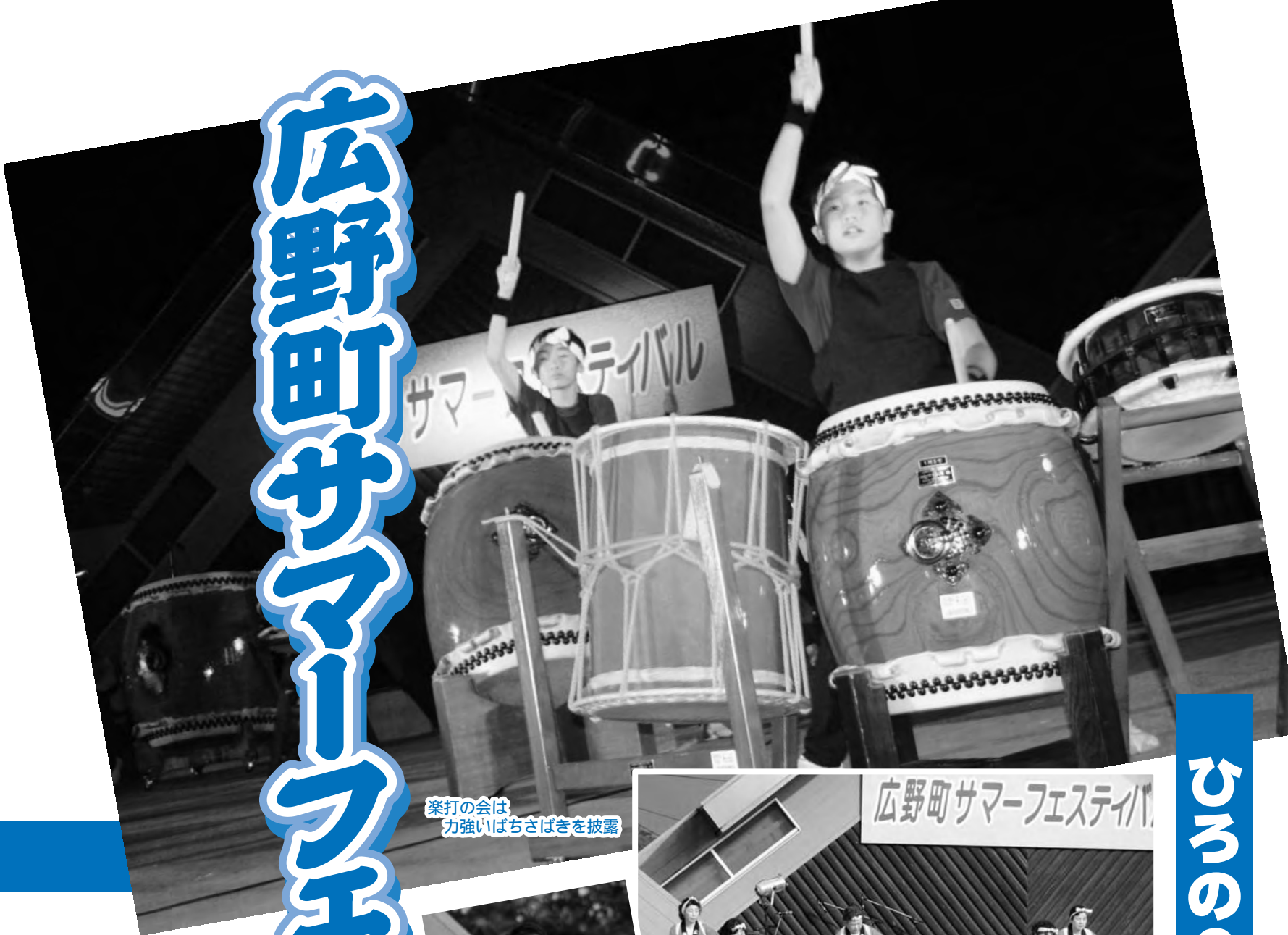
楽打の会は力強いばちさばきを披露