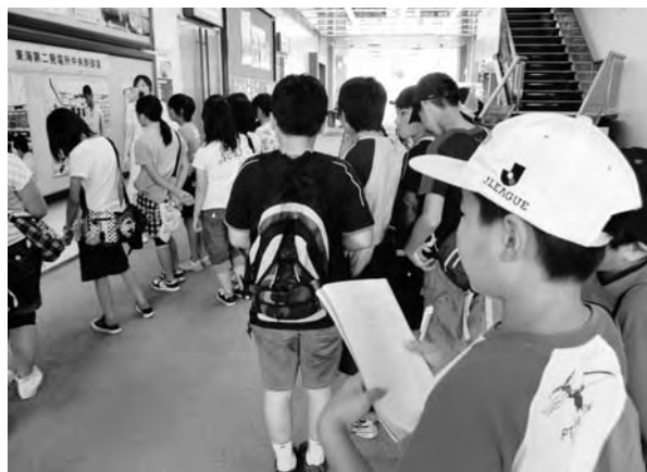
▲職員の説明にメモを取る児童

原子力関連施設見学会は8月2日、広野小5・6年生を対象に行われ、東海テラパーク（茨城県東海村）と日立シビックセンター（茨城県日立市）を見学しました。81人が参加しました。見学会では、実際の発電所を見学して原子力発電の仕組みを学習。また、原子力技術の歴史を年表で振り返るなどして理解を深めました。