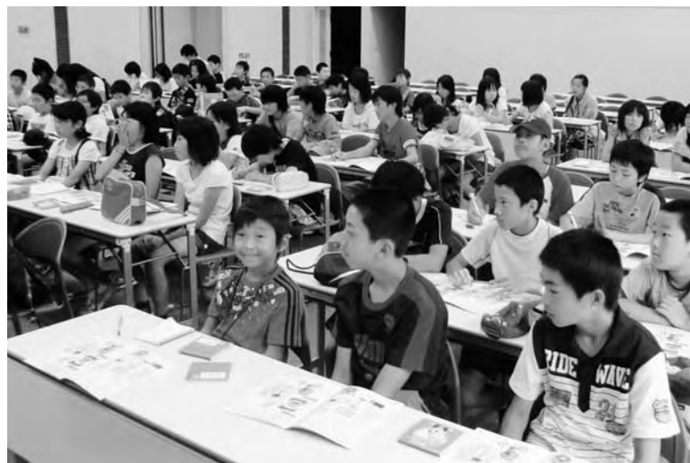
▲東海テラパークで原子力について学習する児童