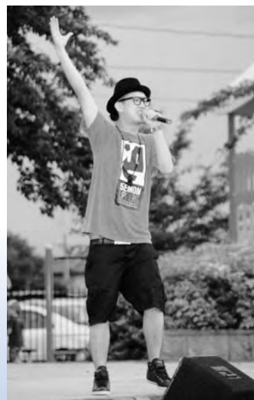
広野町にゆかりのあるPEACEさん

メンバーに広野町の感想を聞いたところ、「町がきれいですてきです」、「お客さんが温かった」、「涼しくて、星がきれい」、など広野町に好感を抱いていた。