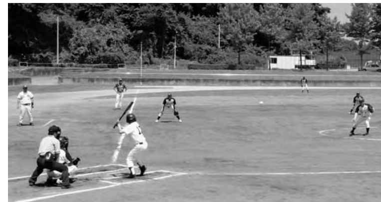
▲広野町壮年ソフトボールチーム

広野町では、壮年ソフトボール、9人制バレーボール、卓球、バドミントンに出場。バドミントンが準優勝、壮年ソフトボールが第3位に輝きました。