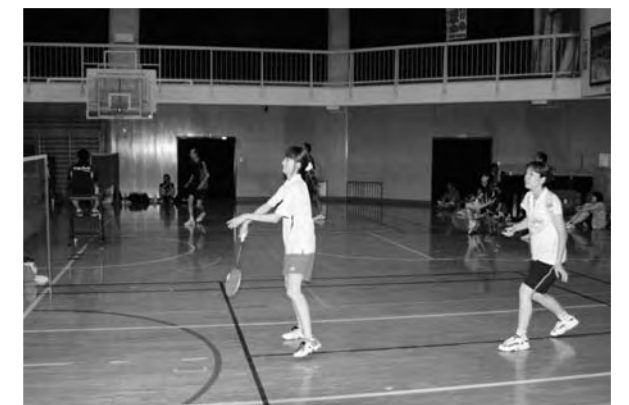
▲広野町バドミントンチーム