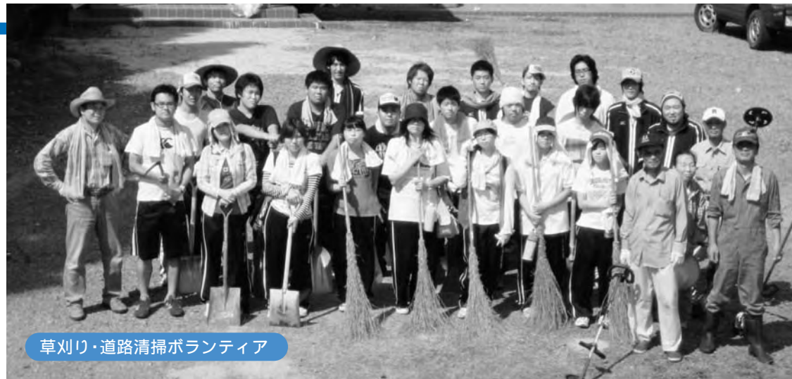
草刈り・道路清掃ボランティア