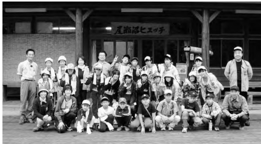
◀自然体験学習 IN 尾瀬 参加者の皆さん

本事業は、東京電力株式会社広野火力発電所との共催で、毎年夏に実施しているものです。