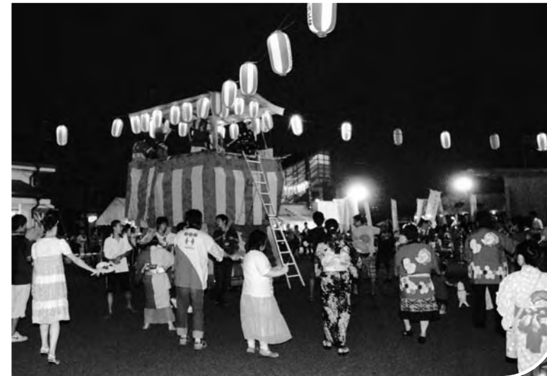
▲駅前盆踊りの様子

広野駅前盆踊り大会は8月15日、駅前で行われました。会場には商工会による露店が並び大勢のお客さんでにぎわいました。 やぐらの周りでは、亀ヶ崎・東下地区青年会のみなさんの太鼓とおはやしに合わせお盆を広野で過ごしていた帰省者や子どもたちが盆踊りを踊りました。