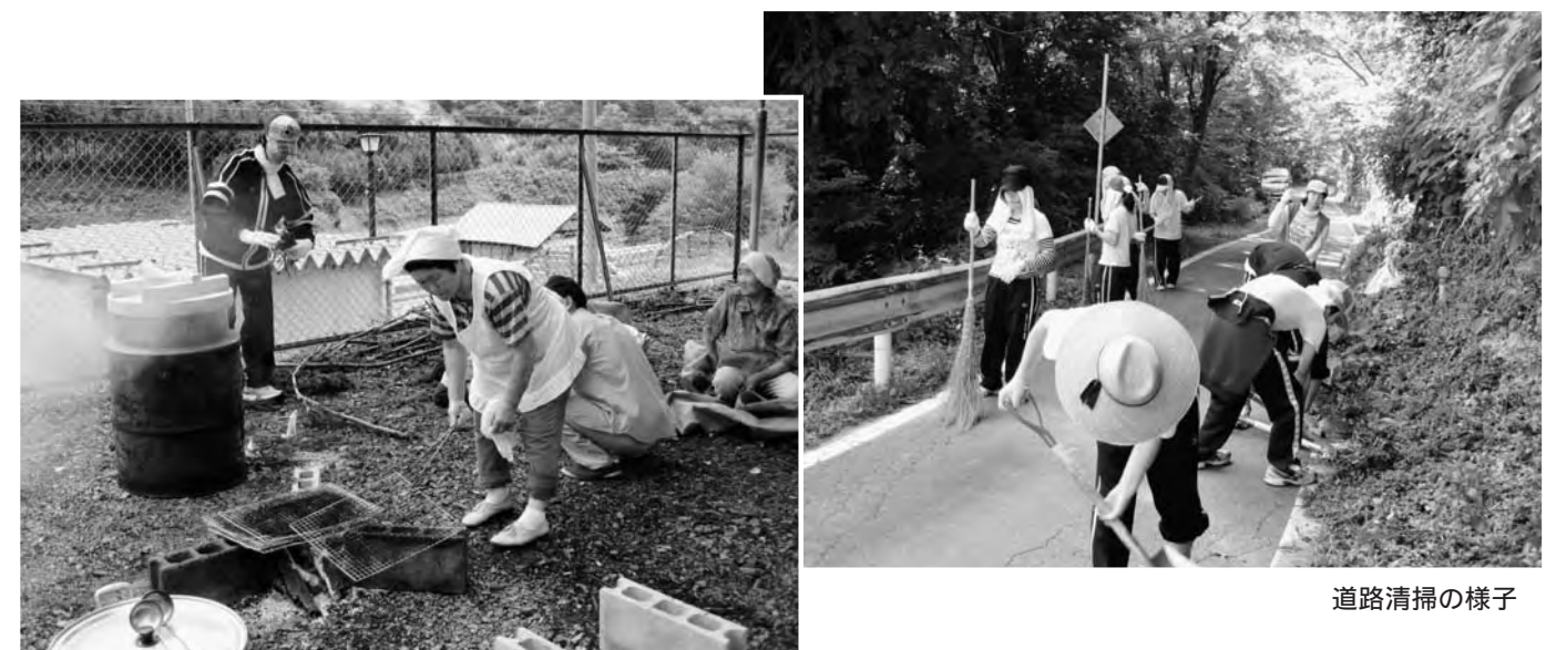
羽釜でお米を炊きました