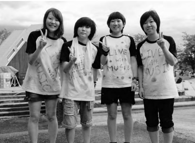
メンバーがデザインしたTシャツで登場したGLoRiA

「GLoRiA(グロリア)にとって音楽とはつながりです。音楽でつながっているからメンバーが集まることができます。」と話してくれたのは昨年も出演したGLoRiAのメンバー。高校を卒業したメンバーはこの1年それぞれの道を突き進んでいた。そんな彼女たちを再び同じステージへと導いたのは音楽と地元広野町だった。