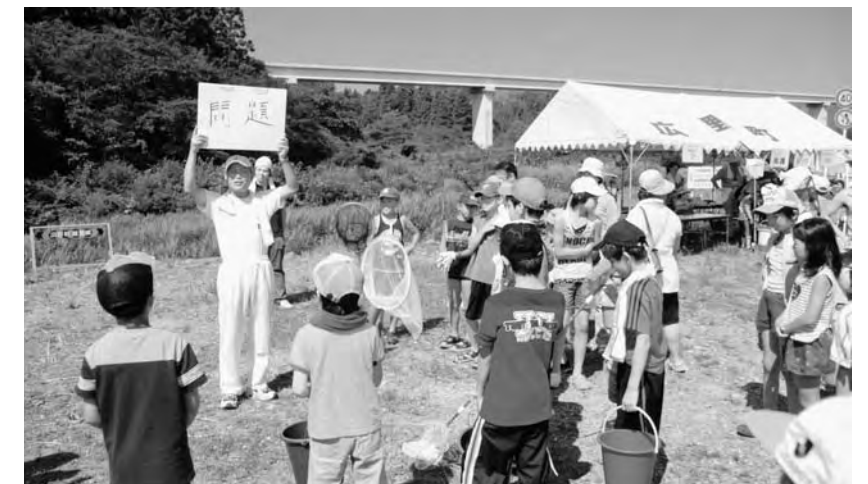
▲水辺の学校では浅見川に関するクイズが出されました