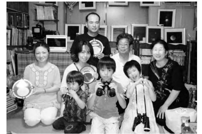
▲星空観察教室の皆さん