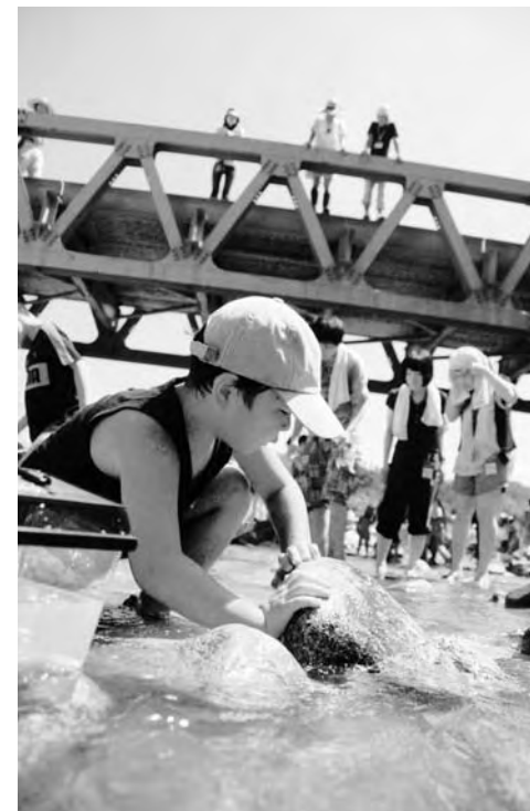
▲岩かげに鮎を探す子どもたち

第2部では鮎つかみの体験が行われ、親子連れは、浅見川に放たれた鮎をあみや素手で追いかけていました。