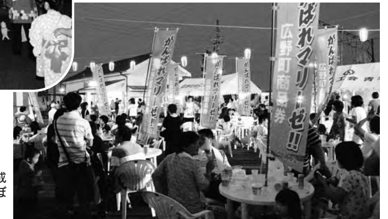
▶会場には商工会で作成したマリーゼ応援のぼりがなりました

広野駅前盆踊り大会は8月15日、駅前で行われました。会場には商工会による露店が並び大勢のお客さんでにぎわいました。 やぐらの周りでは、亀ヶ崎・東下地区青年会のみなさんの太鼓とおはやしに合わせお盆を広野で過ごしていた帰省者や子どもたちが盆踊りを踊りました。