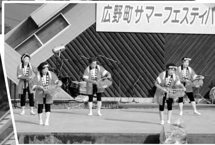
笠踊り保存会の皆さん