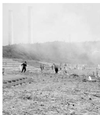
クリーンアップ作戦

まず、建設課建設グループ関係事業については、去る5月23日から24日にかけての豪雨により、1255ミリメートルの雨量を記録し、狐石地区の治山施設が被災しました。人家と町民の生活への影響を最小限にするため、予備費を充用し、応急工事を実施しました。また、6月13日にはクリーンアップ作戦を実施しました。多くの町民の皆さまや各種団体の参加のもと、