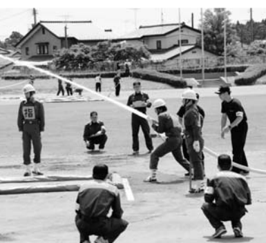
消防操法大会競技

次に、7月25日富岡町を会場に第37回福島県消防操法大会双葉地方大会が開催され、本町からは、ポンプ自動車の部に第4分団ならびに小型動力ポンプの部に第3分団が出場しました。その結果は惜しくも両種目とも団体