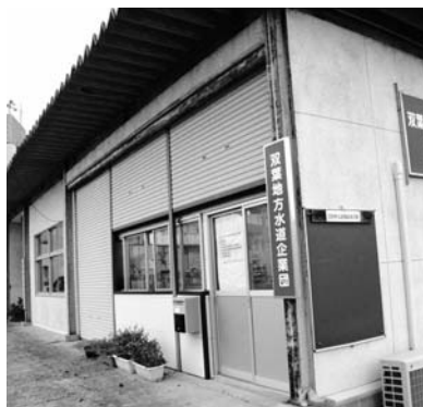
水道企業団広野営業所

次に、双葉地方水道企業団における水道事業についてですが、広野町への広域水の給水については、計画どおり年度内開始に向けて、現在、事業に取り組んでいるところです。なお、水道水の切り替え作業については、万全を期して対応していただくよう水道企業団に強く要望しているところであり、町民の皆さまには、安全で安定した給水環境が整い次第、広報紙などで周知したいと考えています。