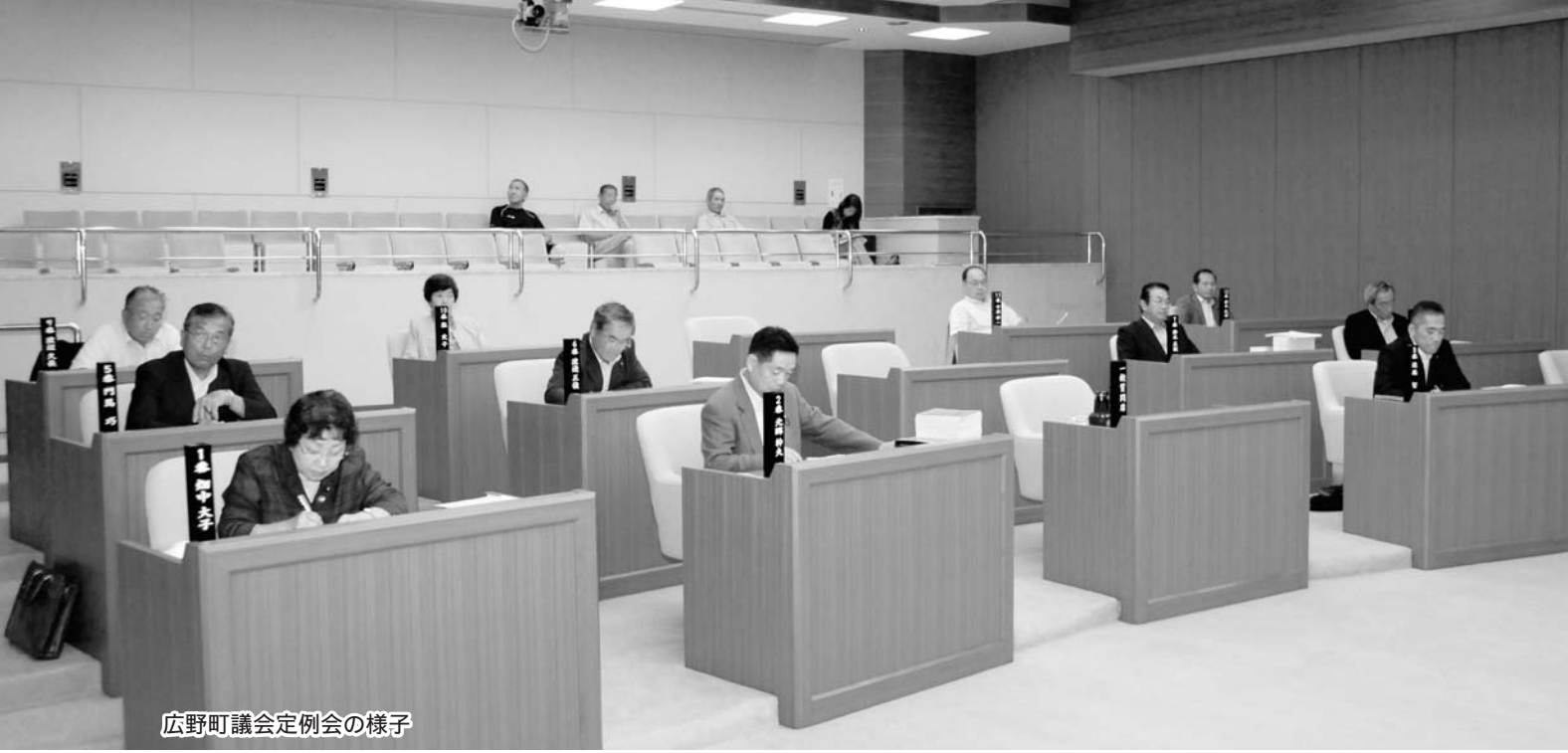
広野町議会定例会の様子