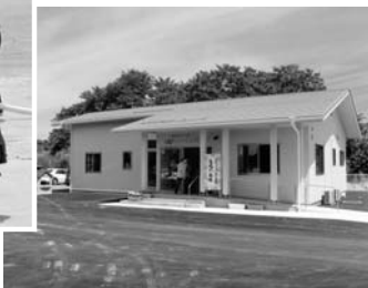
のびっこらんど広野

次に、7月25日富岡町を会場に第37回福島県消防操法大会双葉地方大会が開催され、本町からは、ポンプ自動車の部に第4分団ならびに小型動力ポンプの部に第3分団が出場しました。その結果は惜しくも両種目とも団体