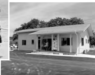
のびっこらんど広野

次に、7月25日富岡町を会場に第37回福島県消防操法大会双葉地方大会が開催され、本町からは、ポンプ自動車の部に第4分団ならびに小型動力ポンプの部に第3分団が出場しました。その結果は惜しくも両種目とも団