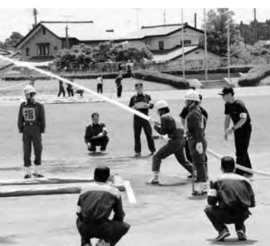
消防操法大会競技

次に、7月25日富岡町を会場に第37回福島県消防操法大会双葉地方大会が開催され、本町からは、ポンプ自動車の部に第4分団ならびに小型動力ポンプの部に第3分団が出場しました。その結果は惜しくも両種目とも団