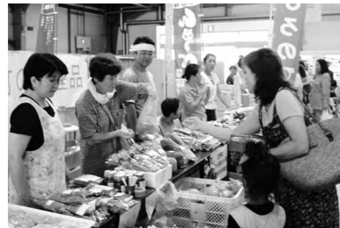
町産の農産物の販売とPR

二ツ沼総合公園直売所利用組合は8月29日、いわき市小名浜潮目交流館(さんかく倉庫)で開催された、第2回いわきカツオ祭りに参加。県内外の方に広野産農作物を知ってもらい消費拡大につなげようとPRしました。新米の試食にはたくさんのお客さんが足を止めていました。