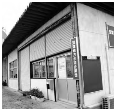
水道企業団広野営業所

次に、双葉地方水道企業団における水道事業についてですが、広野町への広域水の給水については、計画どおり年度内開始に向けて、現在、事業に取り組んでいるところです。なお、水道水の切り替え作業については、万全を期して対応していただくよう水道企業団に強く要望しているところであり、町民の皆さまには、安全で安定した給水環境が整い次第、広報紙などで周知したいと考えています。