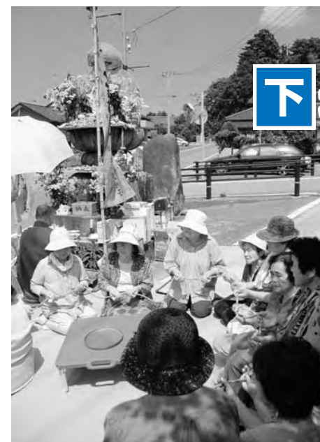
数珠繰りをする皆さん

下北迫地区の皆さんが、林蔵寺の住職さんを招き地蔵講を行いました。住職さんの読経の後、「南無阿彌陀仏、ご祈祷念仏」を掛け合いながら唱え、数珠繰りをしました。