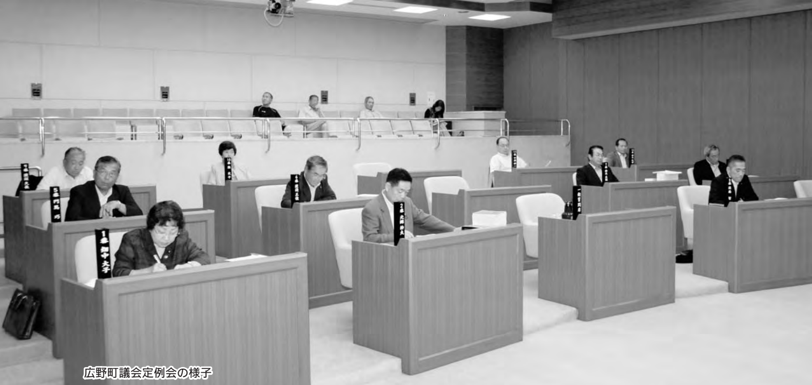
広野町議会定例会の様子