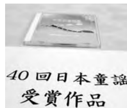
40回日本童謡受賞作品