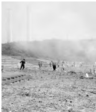
クリーンアップ作戦

まず、建設課建設グループ関係事業については、去る5月23日から24日にかけての豪雨により、1255ミリメートルの雨量を記録し、狐石地区の治山施設が被災しました。人家と町民の生活への影響を最小限にするため、予備費を充用し、応急工事を実施しました。また、6月13日にはクリーンアップ作戦を実施しました。多くの町民の皆さまや各種団体の参加のもと、