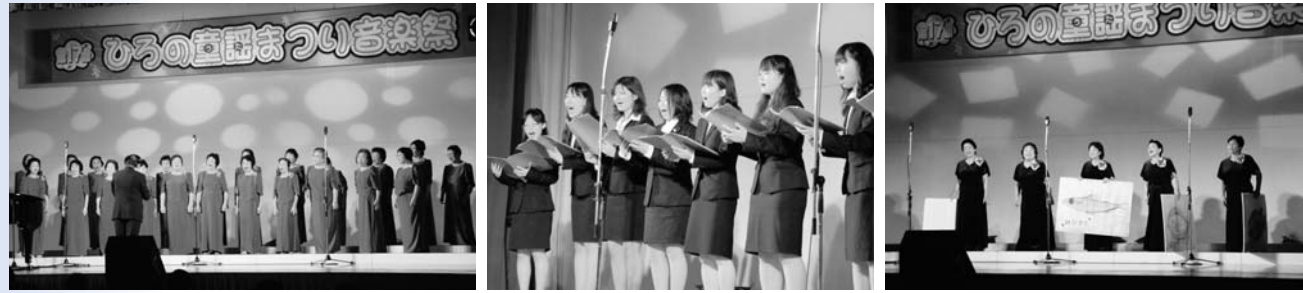
女声合唱団新生ラ・ヴィアン・ローズ いわき短期大学合唱同好会 アンサンブル・ドルチェ