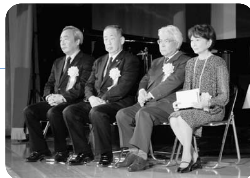
審査員のみなさん