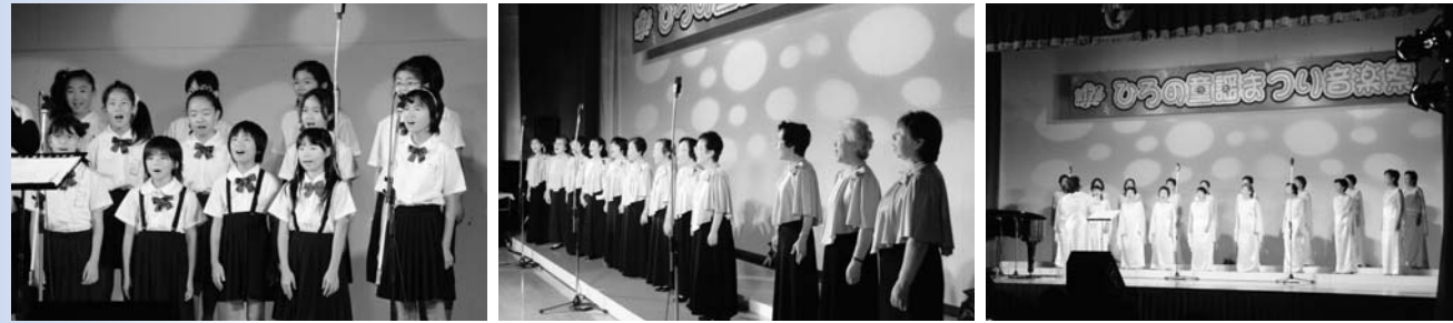
熊町小学校 コーラスふたば 小高フレッシュコーラス