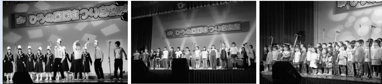
広野中学校 広野小学校 広野幼稚園