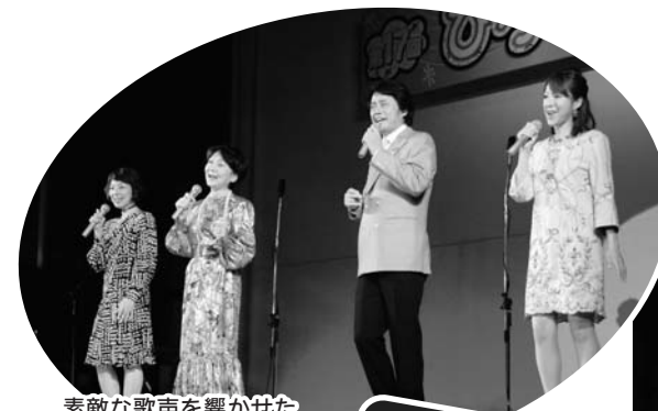
素敵な歌声を響かせた 歌手の皆さん