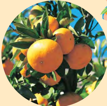
甘みたっぷりのみかん