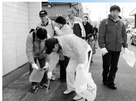
▶清掃活動に汗を流しました

JR東日本いわき地区による清掃活動が行われました。この活動は地域社会活動への参加を目的とし、広野駅から二ツ沼総合公園までの区間で行われました。参加した皆さんは3つのコースに分かれ二ツ沼総合公園を目指しました。