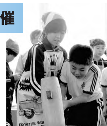
▶もちつきをする児童

広野小学校で収穫祭が行われ、5年生と1年生がもちつきをしました。使用されたもち米は総合学習の一環で5年生が田植えから収穫までを行ったものです。うすときねを使い、保護者の方の協力を得ながらもちをつき、つきあがったもち雑煮にして味わいました。児童は自分たちが育てたお米の味を味わいながら収穫の喜びを感じていました。