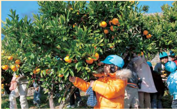
幼稚園みかん狩り