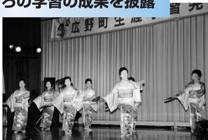
◀稽古の成果を披露した出演者の皆さん

平成20年度生涯学習発表会が中央体育館で開催されました。発表会は広野小学校器楽部の「広野賛歌」の演奏で開幕しました。15団体が出演し、日ごろの稽古の成果を披露し、会場に訪れた人を楽しませていました。