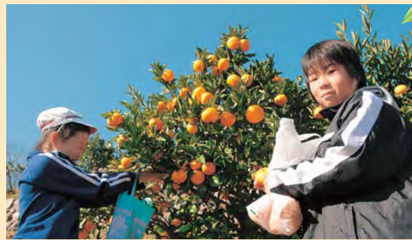
丁寧にみかんをもぎとる児童