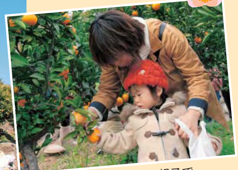
げんキッズでは親子で みかん狩りをしました