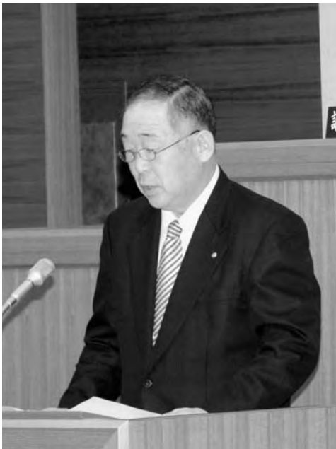
▲一般経過報告をする町長

12月10日～12日の3日間第4回広野町定例会が行われました。まずはじめに山田町長より、これまでの町政経過報告がありました。その後、総務文教常任委員会と産業厚生常任委員会より調査報告がなされました。一般質問を経て、議案を審議し、平成20年度広野町一般会計補正予算をはじめ12の議案が可決されました。