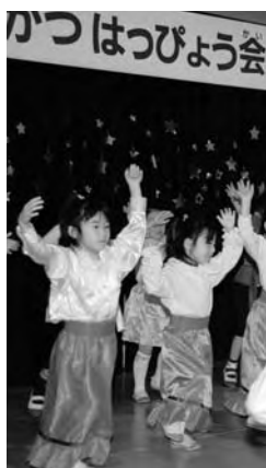
▲音楽にあわせてダンスを踊りました(幼稚園)