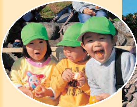
甘いみかんに 笑顔がこぼれる