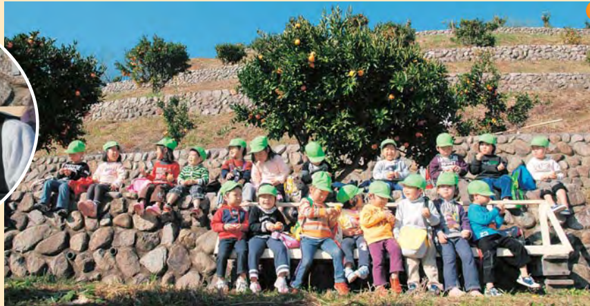
青空の下みかんを食べる子どもたち