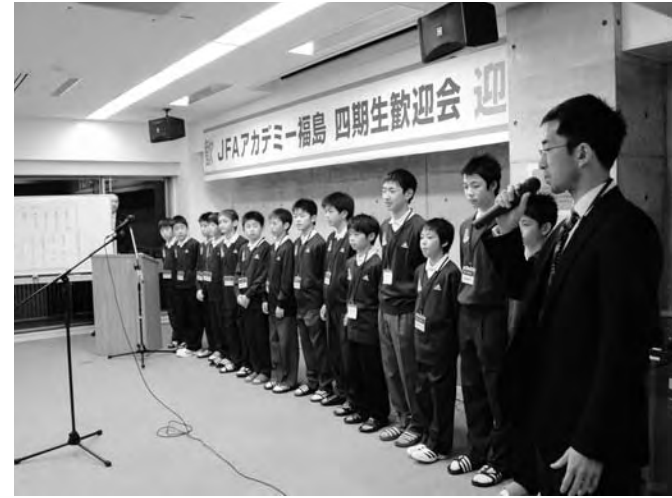
JFAアカデミー福島4期生歓迎会の様子

サッカーによる国際人育成支援事業のアカデミー福島4期生15名の入校式が、4月5日J