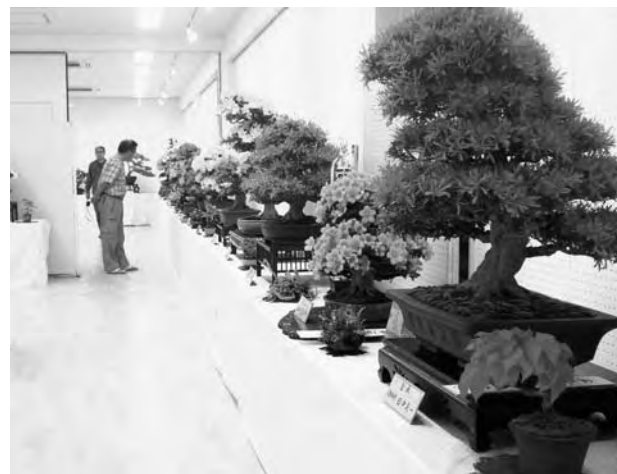
第9回浜通りさつき盆栽展示会の様子 (6月13日、14日ニッ沼総合公園内ギャラリーにて開催)