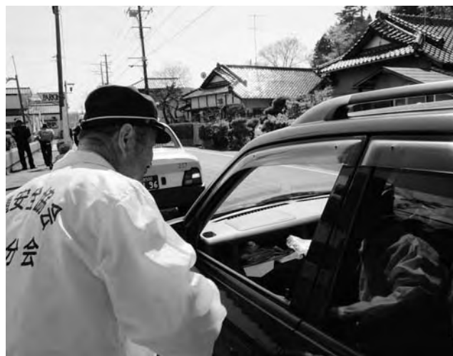
交通安全ふれあいキャンペーンの様子

本年10月に開催されます「ひろの童謡まつり」へ向けた準備を開始いたしました。 なお、委員については、前年度同様、公募により町内から17名の方を委嘱いたしました。