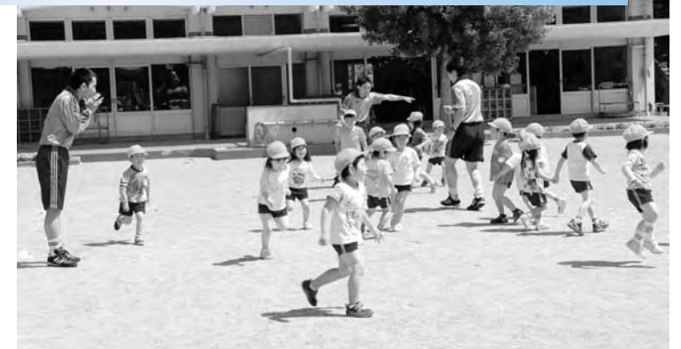
◀子どもたちは元気いっぱい 園庭を走りまわりました

園児たちにサッカーを通じて体を動かしている様々な体験をしてもらおうとJFAアカデミー福島スタッフの皆さん指導による活動が行われました。園児たちは活動の中で友達と協力することなど体だけではなく頭で考えながら運動を楽しんでいました。 この活動は、今後、月1回のペースで行われます。