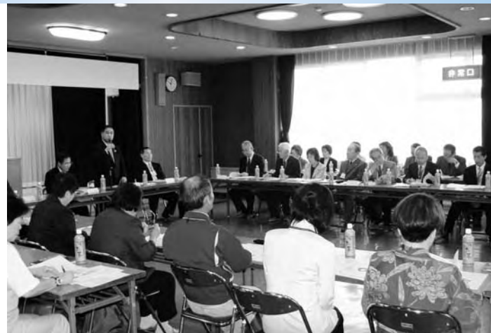
民生委員交流会の様子

昨年7月に災害時の相互応援協定を結んだ埼玉県三郷市の民生委員の皆さんと広野町民生委員の皆さんが公民館で交流会を行いました。会では、お互いの活動概要を説明し意見交換をしました。