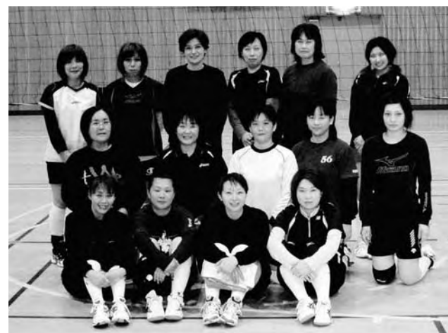
バレーボール部の皆さん