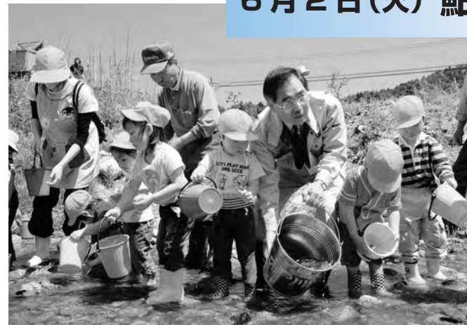
▶鮎の稚魚を浅見川に 放流しました

浅見川鮎愛好会では、鮎の稚魚1万5千匹を浅見川、北迫川、折木川に放流しました。この日は保育所の子ども達もいっしょに鮎を放流しました。 ※浅見川鮎愛好会からのお知らせです。 7月1日より鮎釣りが解禁になりましたが、自然環境を守るため、川や釣り場にゴミを捨てないようゴミの持ち帰りにご協力をお願いいたします。