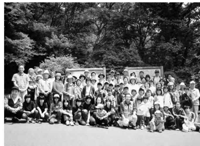
五社山登山参加者の皆さん

さて、本定例会にご提案申し上げます案件は、 ○ 条例案件 3件 ○ 予算案件 4件 ○ 工事請負契約案件 2件 ○ 人事案件 2件 合計 11件であります。 いずれも町政執行上、重要な案件でありますので、慎重にご審議の上、速やかなる御議決をいただきますようお願い申し上げます。本議会召集の挨拶と町政経過の報告といたします。