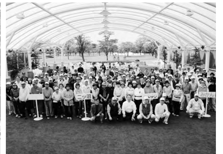
東京電力広野火力杯パークゴルフ大会参加者の皆さん