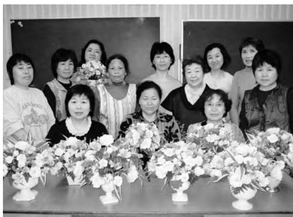
アレンジメントフラワー部会の皆さん