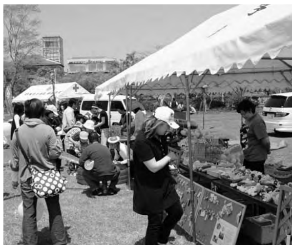
たくさん親子連れでにぎわったふれあいフェスタ

去る5月2日に二ツ沼総合公園におきまして、東京電力広野火力発電所、商工会、パークゴルフ協会等のご協力をいただき、恒例の「二ツ沼ふれあいフェスタ」を開催いたしました。当日は、親子で楽しめるイベントや各出店者による飲食物・物産等の販売・展示などが行われました。また、食の安全・安心と地元農産物を重視したカレーライス、ぶっかけうどんの他、フラワーパークで栽培されているイチゴを使ったジュースや切り花等を販売するなど、大盛況のうちに終了することができました。今後も春の一大イベントとして定着させていきたいと考えております。 また、町民との協働による「童謡のまちなりの」を県内外にPRするため、「童謡のまちなりづくり実行委員会」を去る5月21日に設立し、