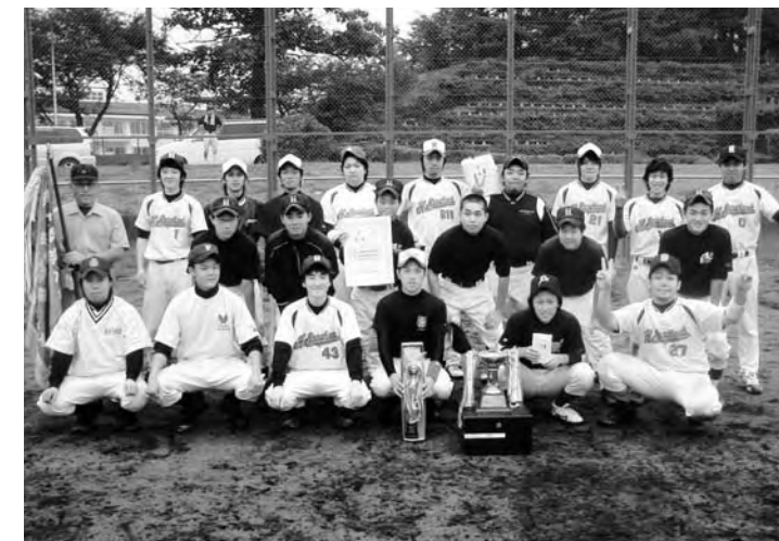
昨年度町内野球大会優勝チーム・スポ少OB

また、部員で組織する「広野クラブ」は、過去に2度全国大会出場、また県大会にも数多く出場している歴史と伝統のあるチームです。毎週火曜日と金曜日が練習日で、国体予選大会をはじめとする各種大会にも毎年出場しております。最近チームも若返り、今までにない盛り上がりを見せていますので、住民の皆様の応援をよろしくお願いいたします。