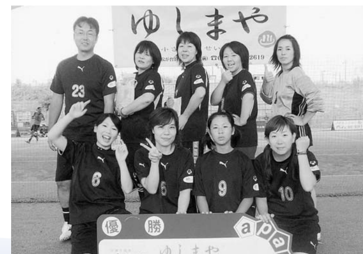
女子フットサル部の皆さん