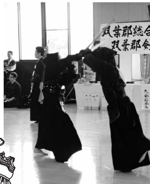
昨年の郡総体より