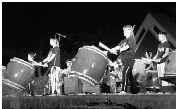
広野サマーフェスティバルにて