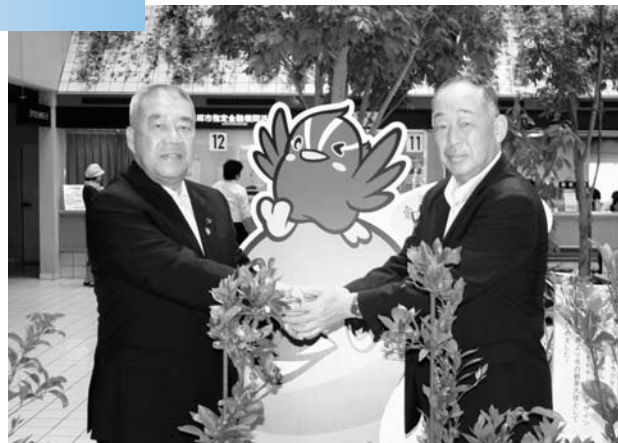
◀握手を交わす木津市長と山田町長

山田町長が7月13日、埼玉県三郷市の木津市長を表敬訪問しました。昨年7月に災害時の相互応援協定の締結をきっかけに、これまでに三郷市立早稲田小学校児童のひろの童謡まつり参加や民生委員の交流会、三郷市産業フェスタ2008への参加など、三郷市と広野町の交流が行われています。