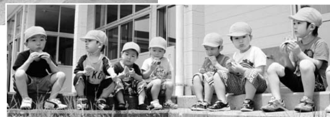
スイカはみんなでおいしくいただきました（保育所）▶

広野保育所と広野幼稚園では毎年恒例の七夕会が7月7日に行われました。会では大きな笹にアイディアいっぱいの飾や願い事が書かれた短冊が飾られました。また、七夕様のお話を聞いたり、スイカ割りをして楽しい時間をすごしました。