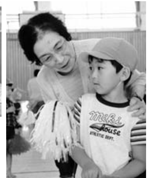
ダンスは上手に踊れたかな？