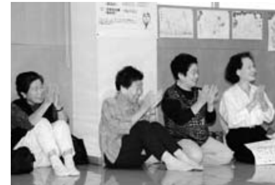
子どもたちの笑顔につられて笑みがこぼれる