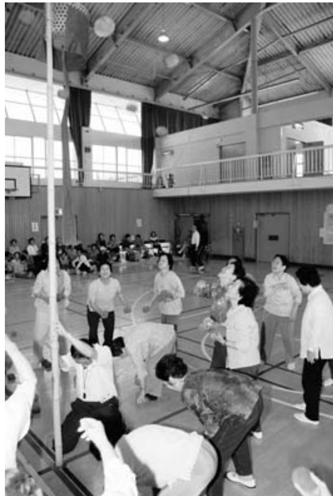
スポーツ大会玉入れの様子

第30回を数える老人クラブスポーツ大会は、健康づくりと会員の交流を目的に毎年行われている。各地区や混合チームで参加、それぞれの種目で点数を競いあった。また、幼稚園児とのダンス交流も行われ、会員にとって楽しい1日となった。 今年は30周年の記念として福祉レクリエーションと健康体操「ひろの町民夢太鼓」が行われた。 このように、現会員やこれまでの歴代会員が開催に工夫をこらし努力したことが30周年という歴史を刻んだ。