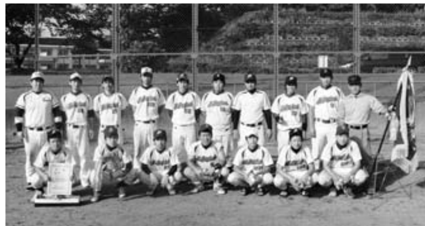
▲優勝を果たしたスポーツ少年団 OBチーム