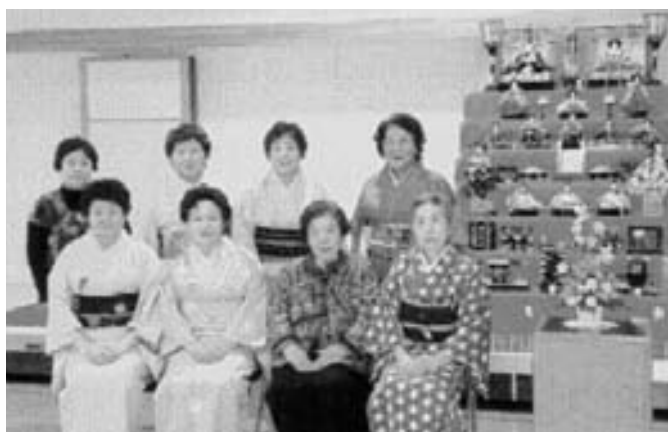
児童館でのひな祭り茶会にて

※主な活動内容 各種点前のお稽古、文化展での呈茶、児童館ひなまつり茶会、諸行事への参加協力、野外研修(茶花)、研修旅行など