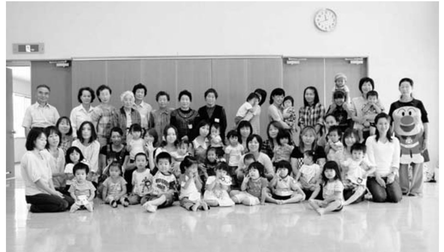
げんキッズに参加した親子と老人クラブ会員