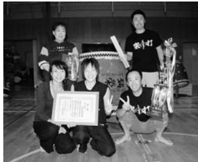
広野昇龍太鼓メンバー

そんな人たちを紹介。また、これをきっかけに自分の趣味やいきがいについて考えてほしい。