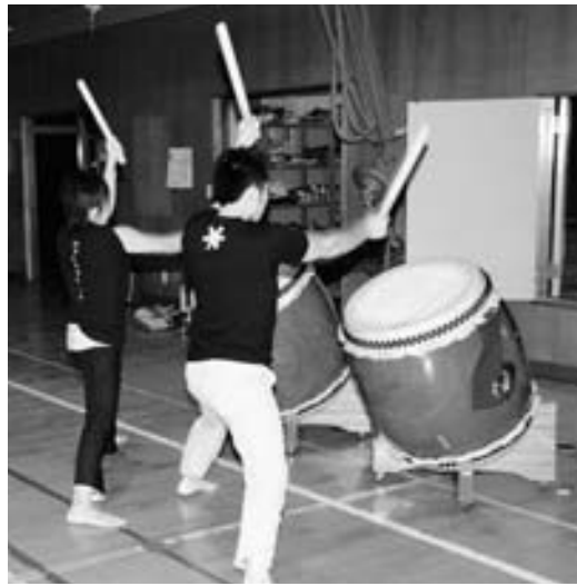
鏡を前に基本動作を確認するメンバー

その広野昇龍太鼓が岩手県北上市で9月6日に開催された第9回全日本創作太鼓フェスティバルで