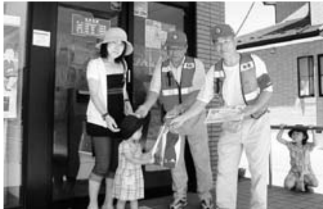
▲認知症サポーター養成講座の様子

振り込め詐欺事件が多発しています。電話などで「振り込んで」と言われたら、家族、知人、警察に相談を。