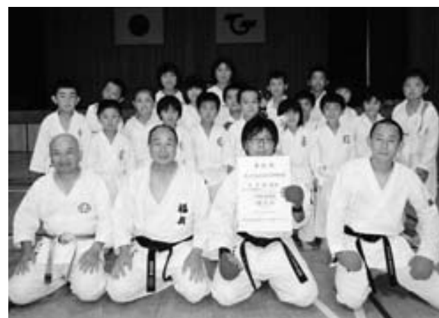
広野町体育協会空手部