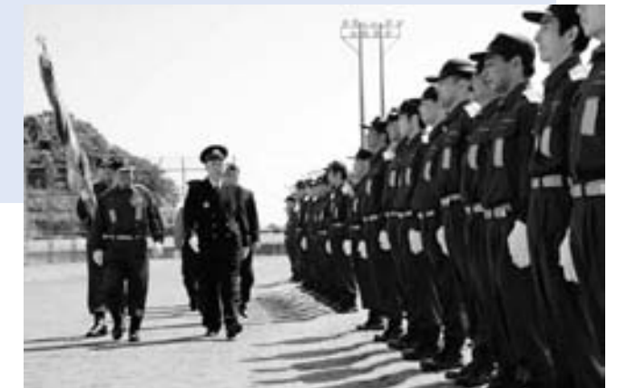
▲秋季検閲式の様子