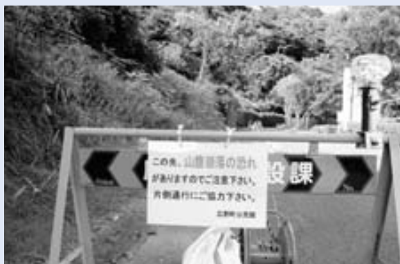
通行には十分ご注意ください

総合グラウンド西側の山腹について、崩落の恐れがあるため通行については十分ご注意ください。また、自動車等については片側通行にご協力ください。