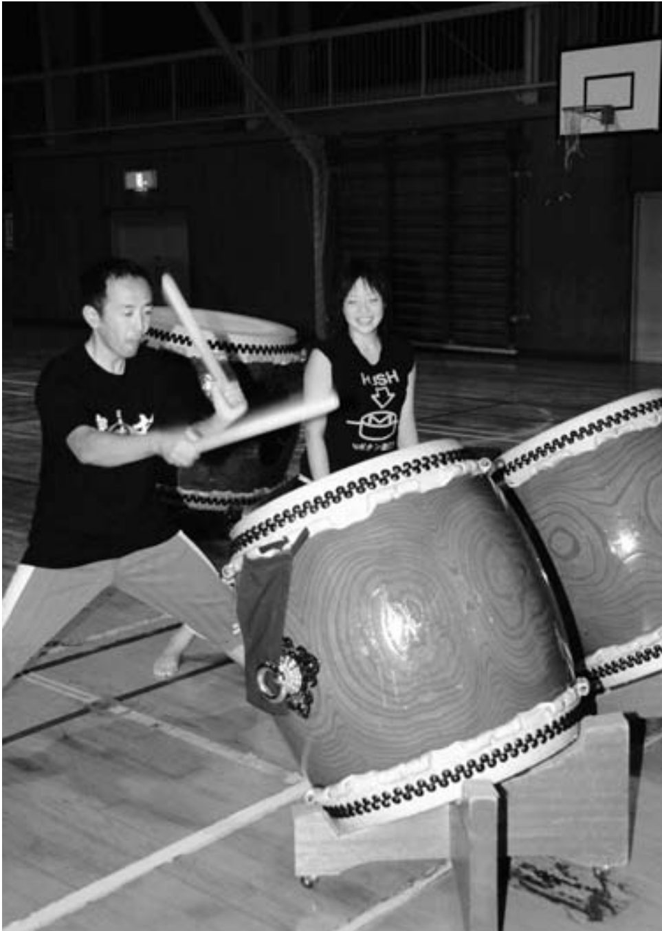
指導には実際に演技をして手本をみせる